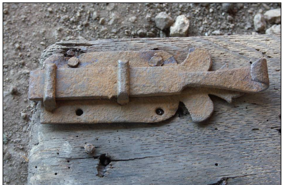
Fig. 2.6. Volet inférieur droit / verrou