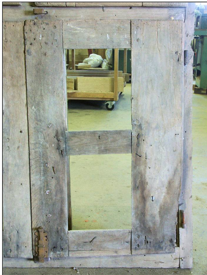
Fig. 2.4. Volet inférieur droit