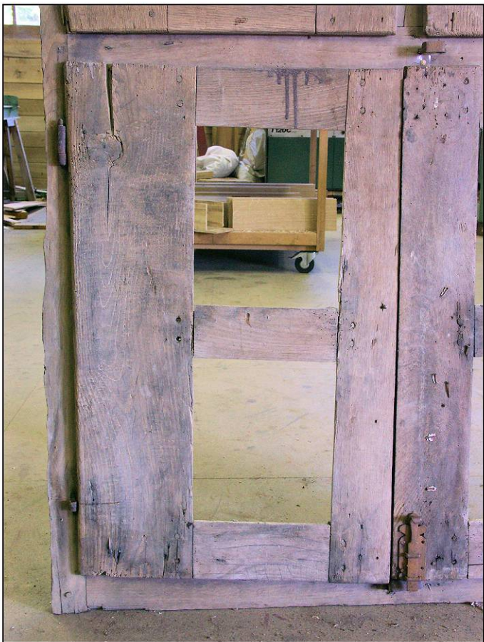
Fig. 2.3. Volet inférieur gauche