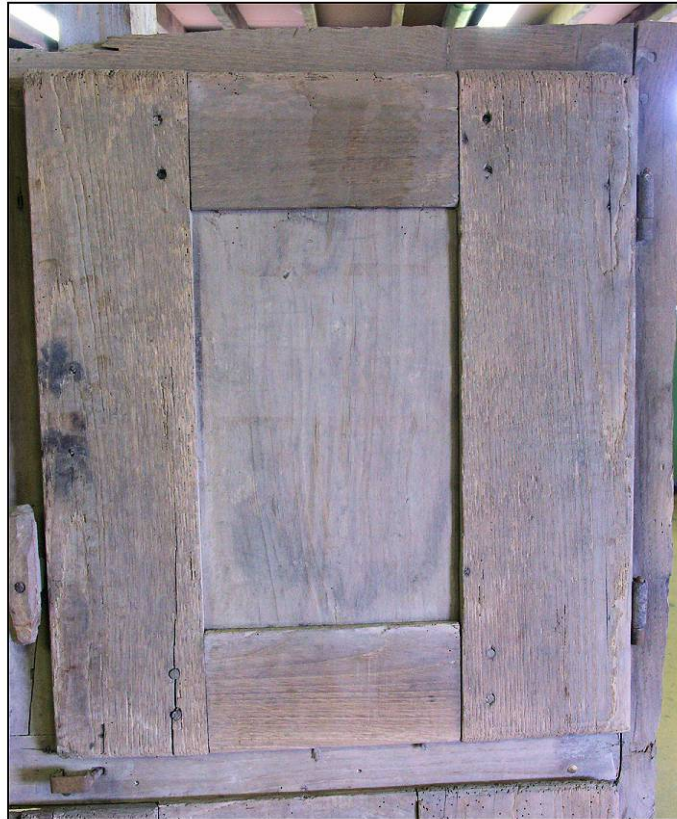
Fig. 2.2. Volet supérieur droit