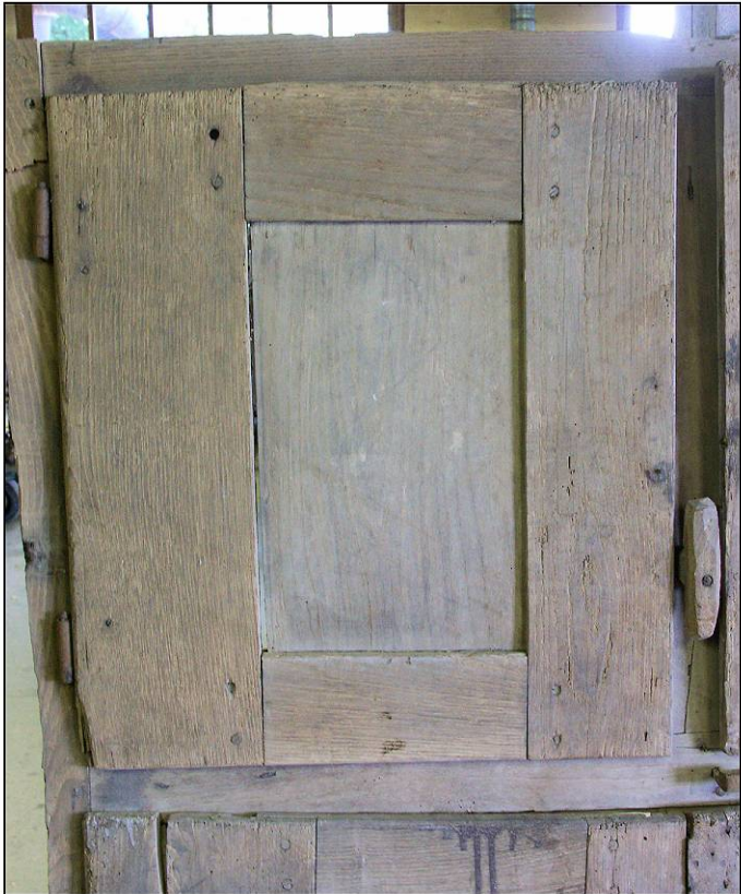
Fig. 2.1. Volet supérieur gauche