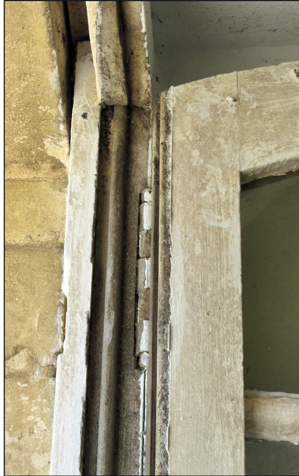
Fig. 3.2. Croisée A (détail angle sup. droit)