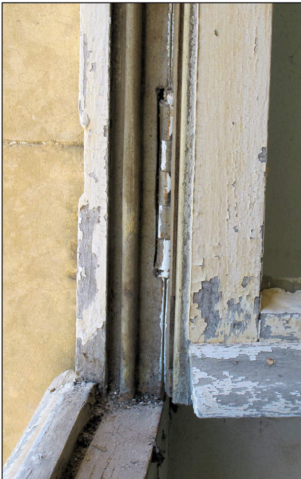
Fig. 3.4. Croisée A (détail de l'imposte)