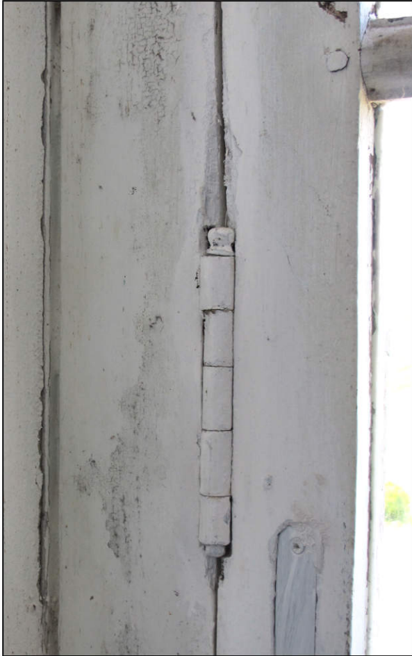
Fig. 3.1. Croisée A (fiche à broche)