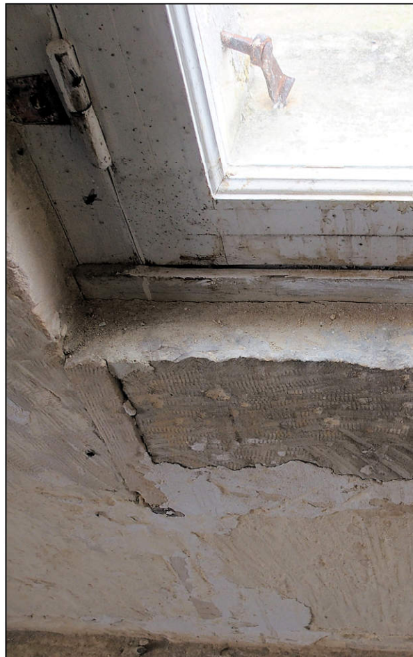
Fig. 3.5. Croisée du pavillon (2ème étage)