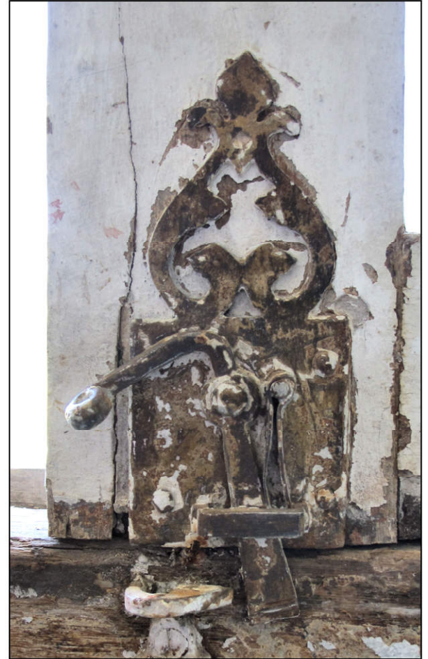
Fig. 3.3. Croisée A (loquet à ressort)