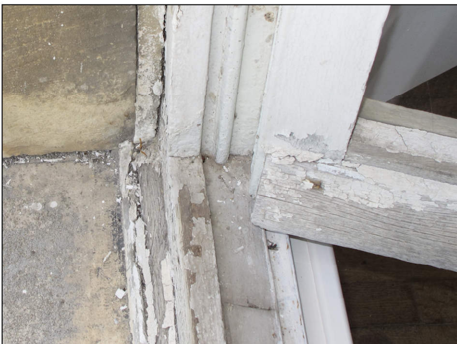
Fig. 3.7. Croisée de la galerie (pièce d'appui)