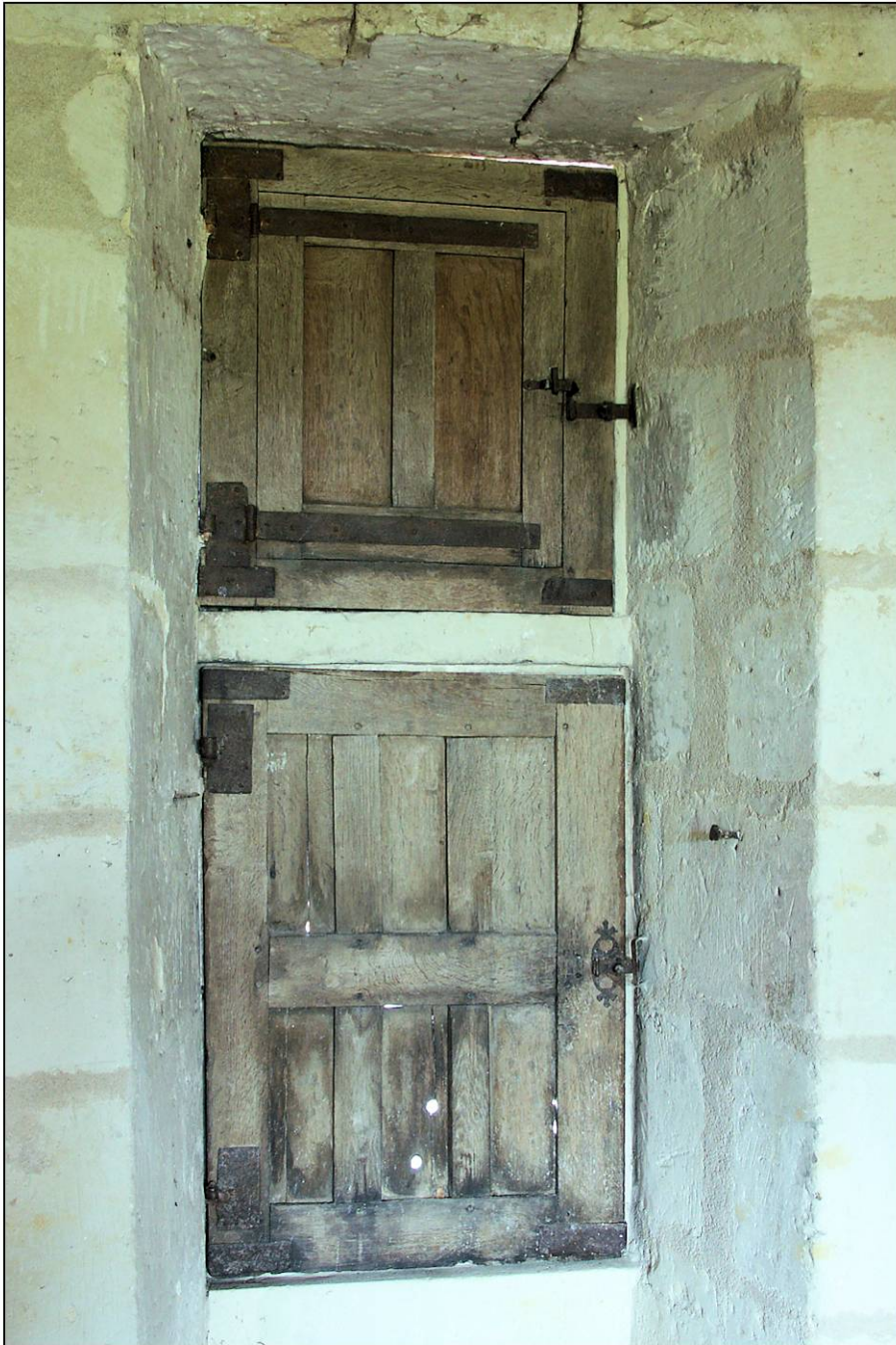
Fig. 1.1. Elévation intérieure