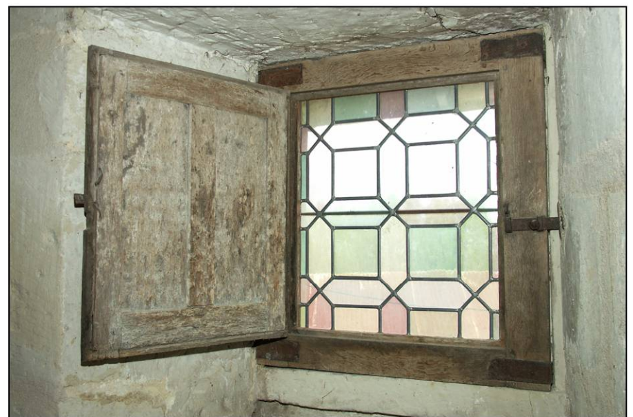
Fig. 1.3. Vantail vitré et volet supérieurs