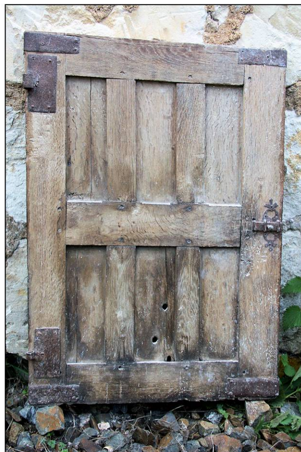
Fig. 1.5. Volet inférieur (intérieur)