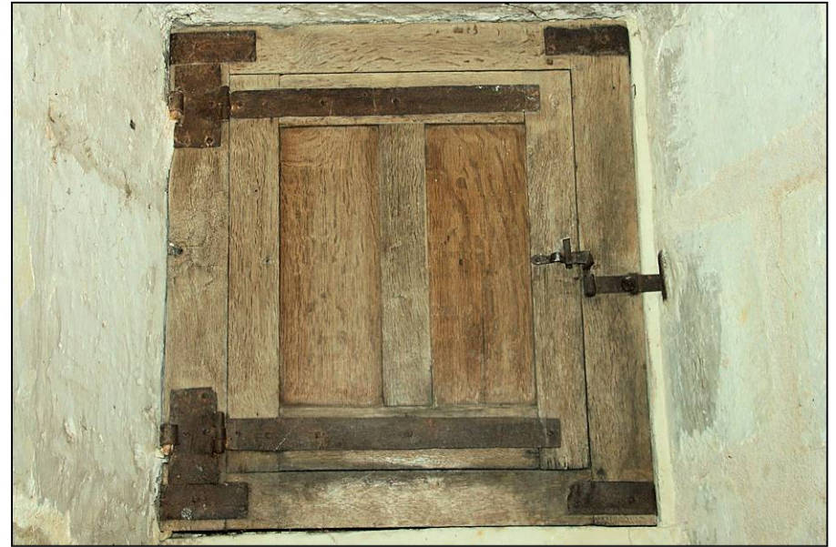
Fig. 1.2. Vantail vitré et volet supérieurs