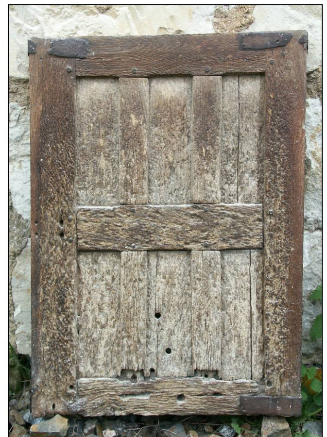
Fig. 1.6. Volet inférieur (extérieur)