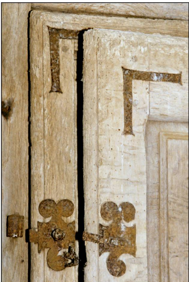
Fig. 3.3. Equerres, loquet et targette (châssis B)