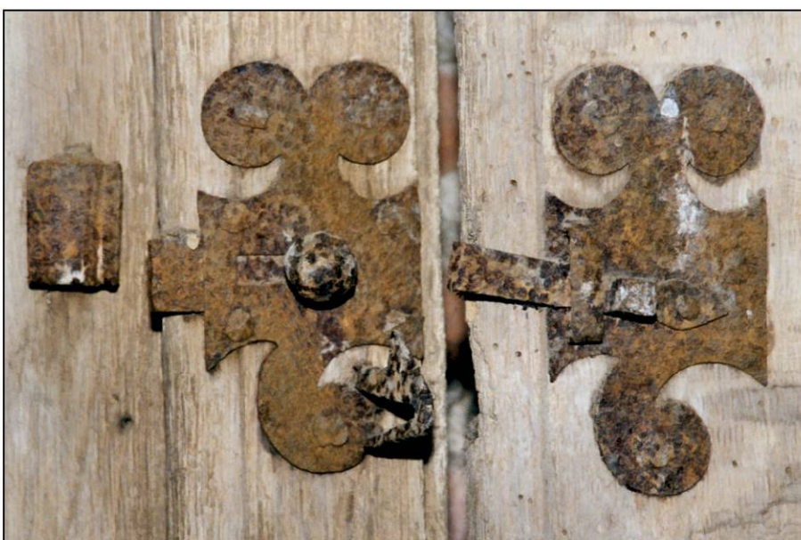
Fig. 3.5. Loquet et targette (châssis B)