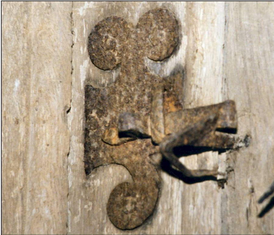
Fig. 3.1. Loquet (châssis A)