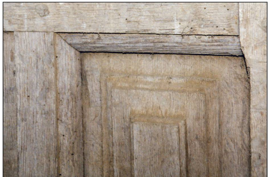
Fig. 3.4. Mouluration (châssis B)