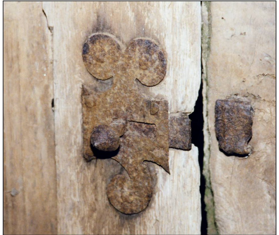
Fig. 3.2. Targette encloisonnée (châssis A)