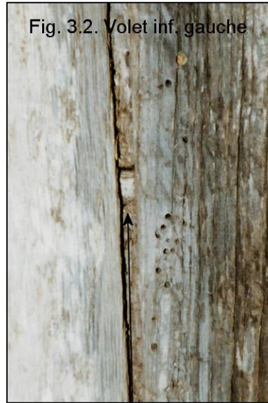
Fig. 3.2. Volet inf. gauche

goujons horizontaux renforçant l'assemblage à rainure et languette