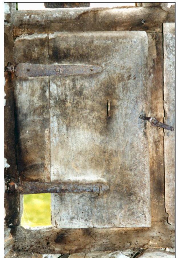
Fig. 3.6. Volet inf. gauche (élévation intérieure)