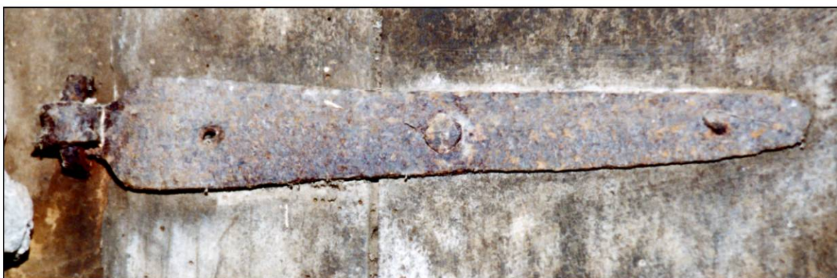
Fig. 3.5. Crampon et penture (volet inf. gauche)