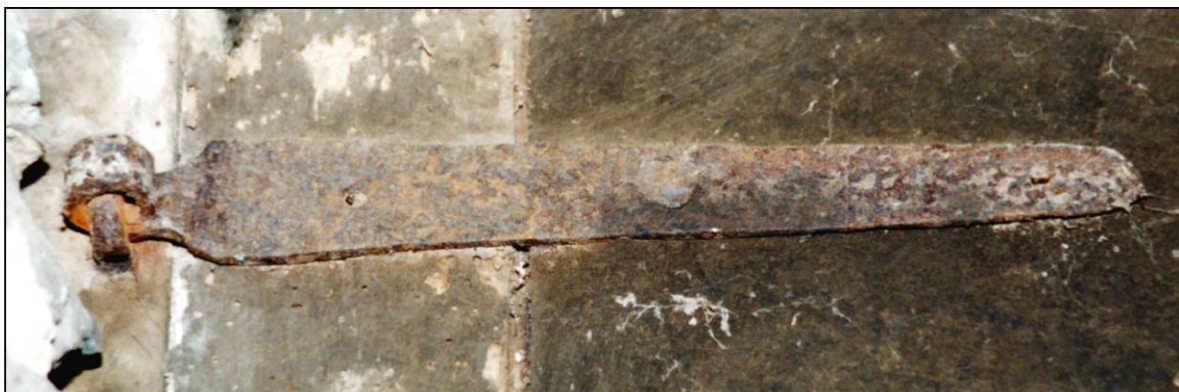
Fig. 3.4. Crampon et penture (volet sup. gauche)