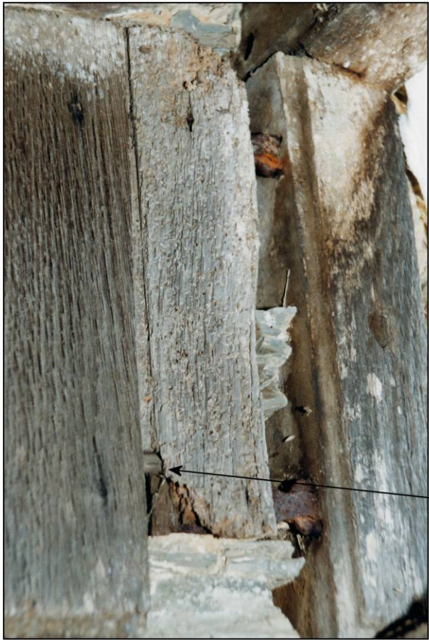
Fig. 3.1. Volet supérieur gauche (élévation ext.)