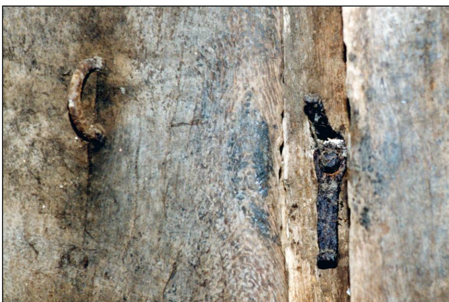
Fig. 3.7. Poignée et tourniquet