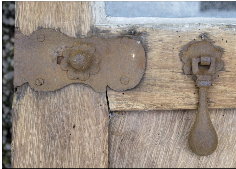
Fig. 4.2. Targette encloisonnée et pendeloque