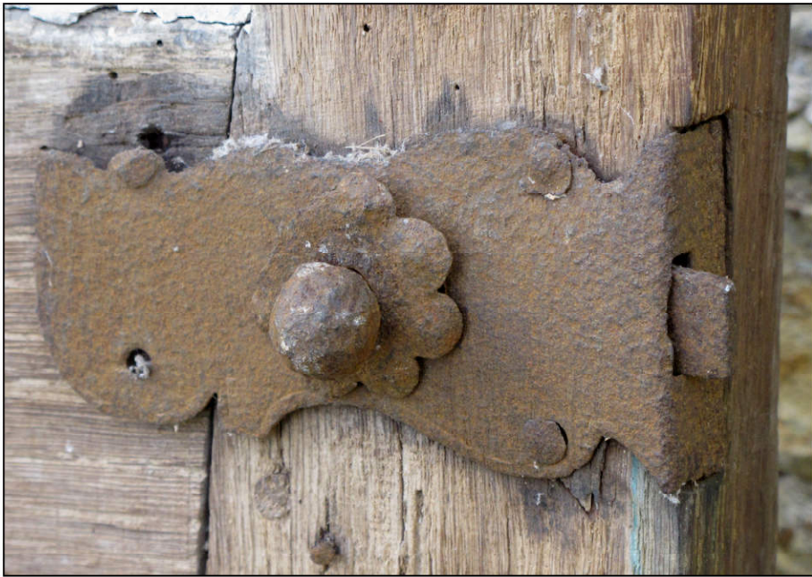
Fig. 4.1. Targette encloisonnée