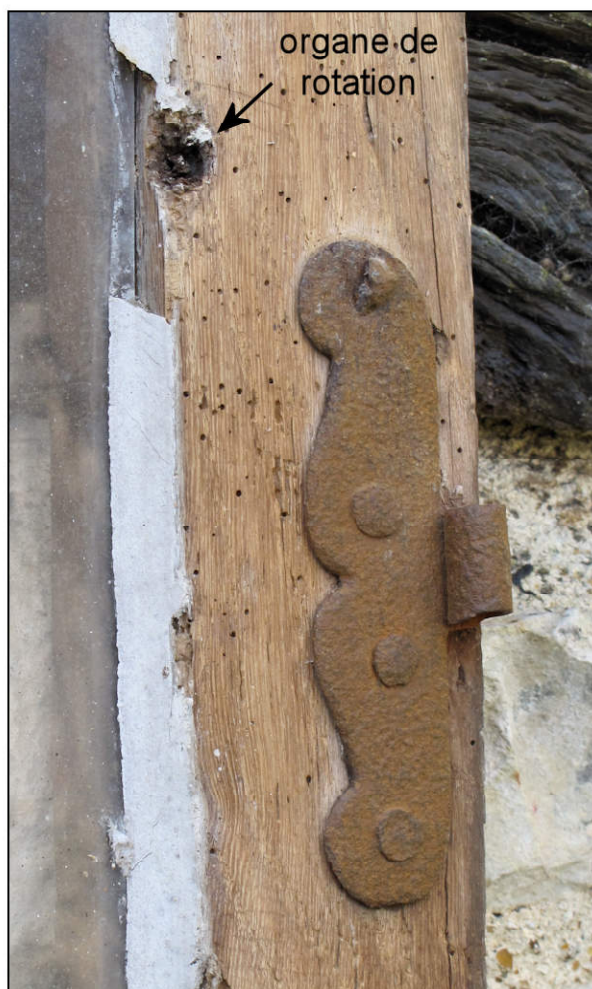
Fig. 4.6. Paumelle en S