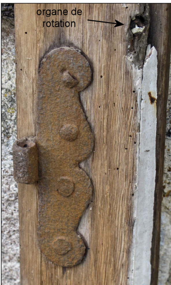
Fig. 4.5. Paumelle en S