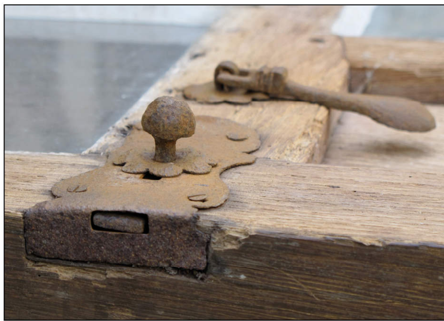
Fig. 4.4. Targette encloisonnée et pendeloque