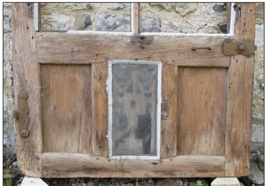
Fig. 2.6. Soubassement à panneaux