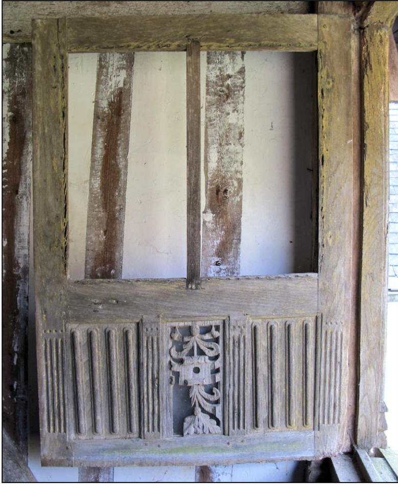
Fig. 2.1. Elévation extérieure