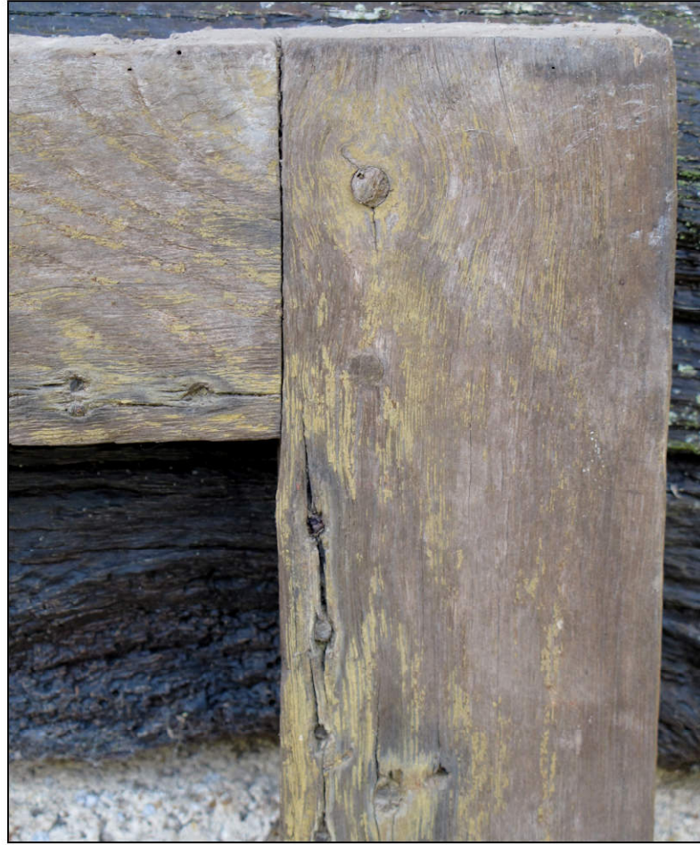
Fig. 2.2. Clouage de la toile cirée