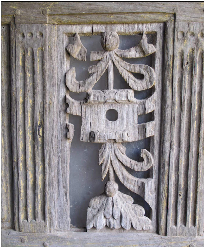
Fig. 2.3. Panneau ajouré à chute d'ornements