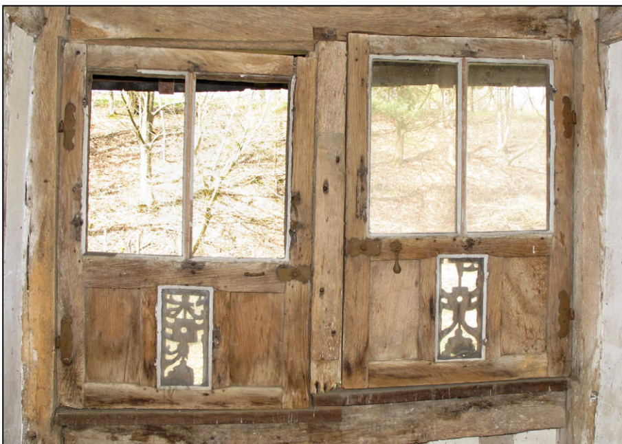
Fig. 2.5. Elévation intérieure des vantaux