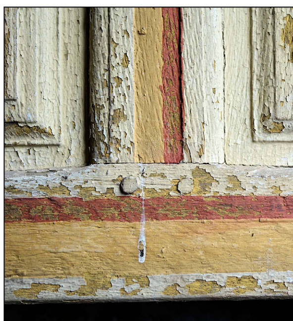
Fig. 5.5. Volet (détail)