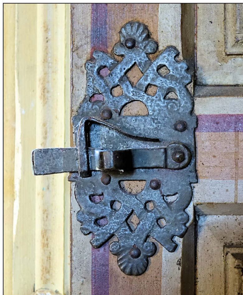
Fig. 5.3. Loquet