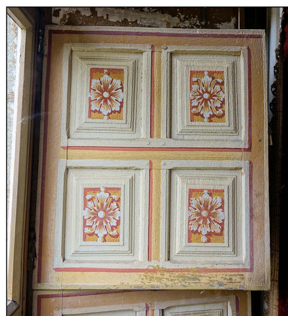
Fig. 5.6. Volet droit (élévation extérieure)