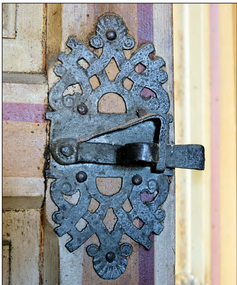
Fig. 5.2. Loquet