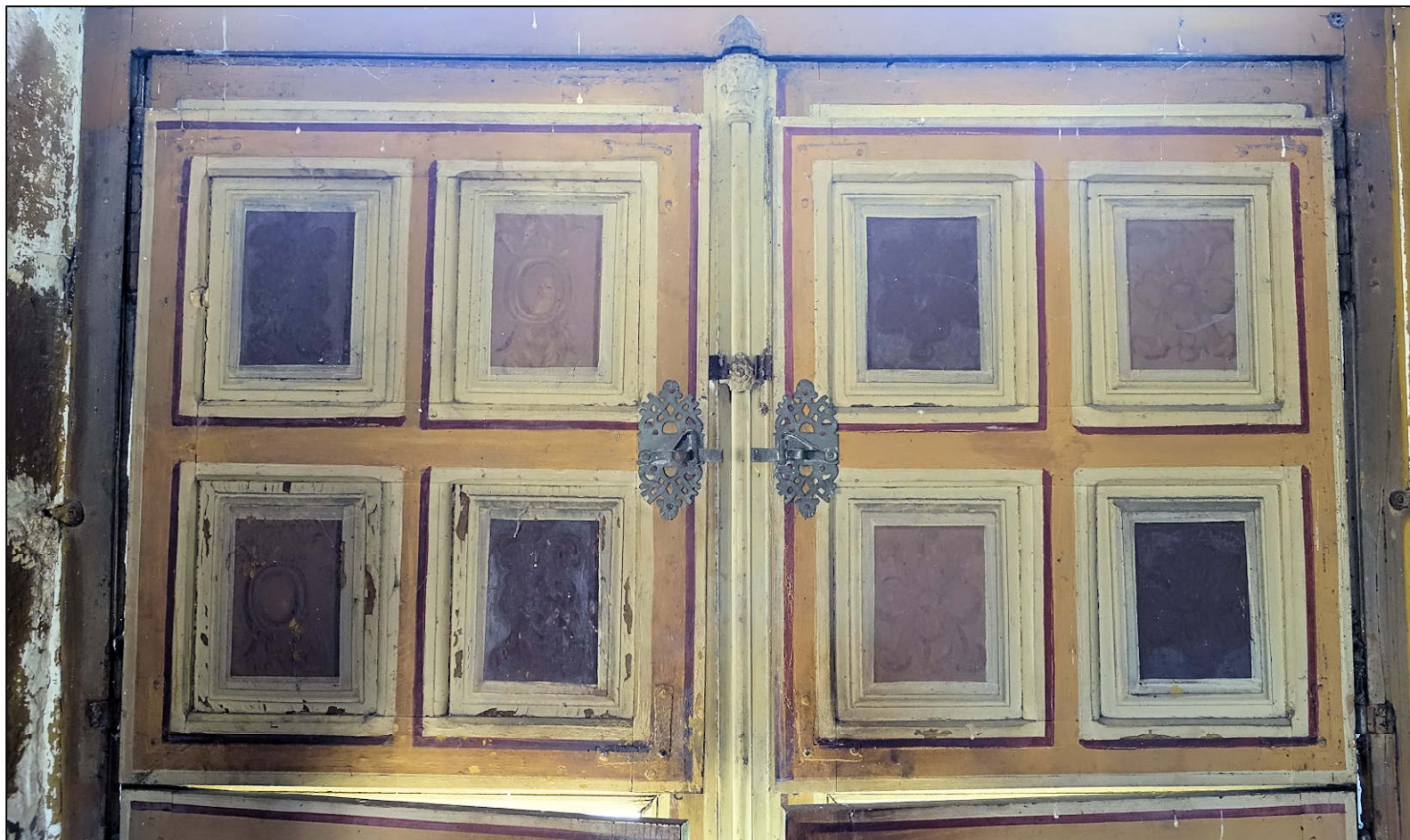
Fig. 5.1. Volets (élévation intérieure)