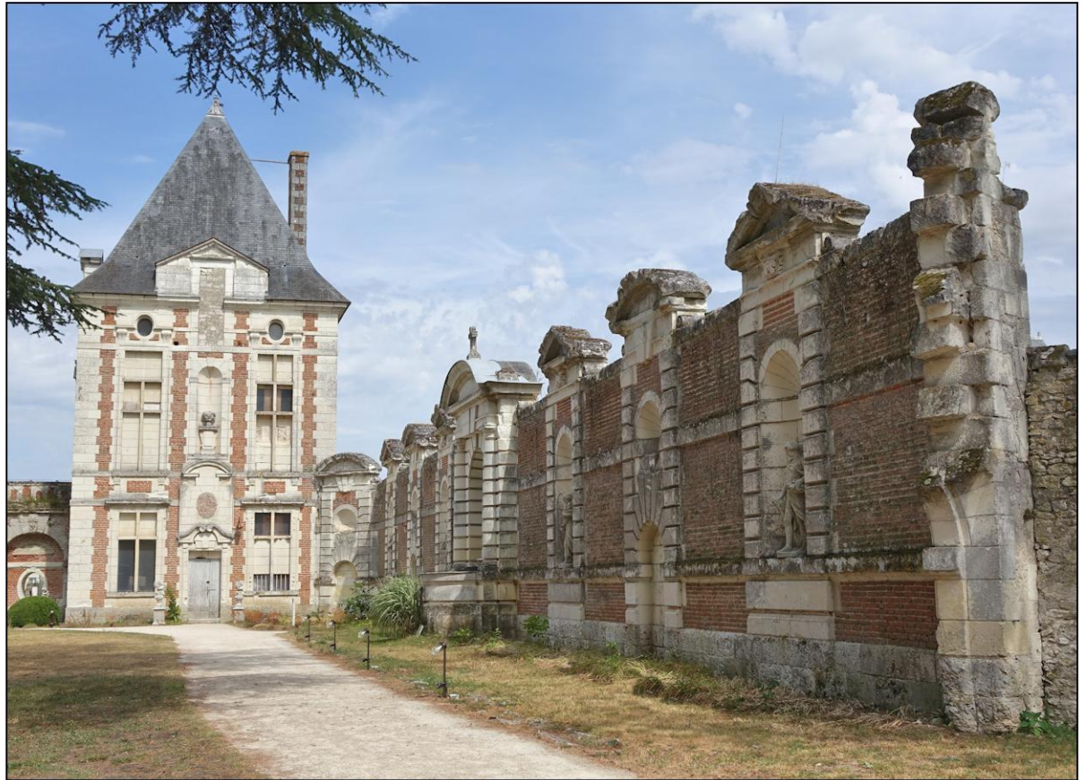
Fig. 2.2. Pavillon Sully (façade ouest)