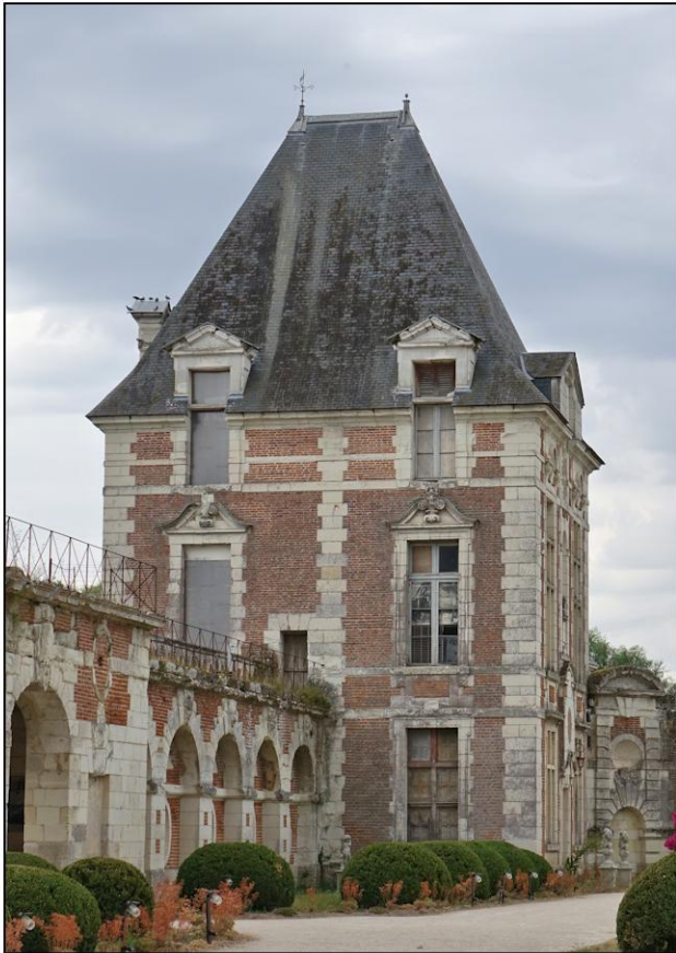
Fig. 2.1. Pavillon Sully (façade nord)