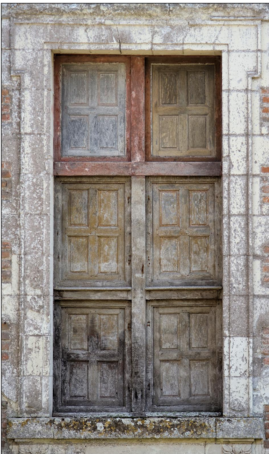
Fig. 2.3. Elévation extérieure