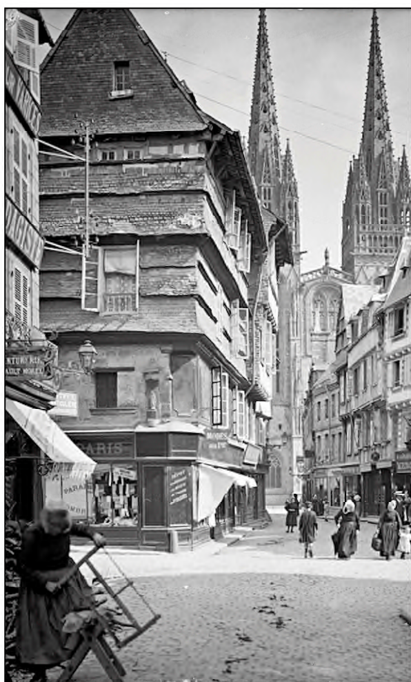
Fig. 7.3. Quimper, 1908-1912