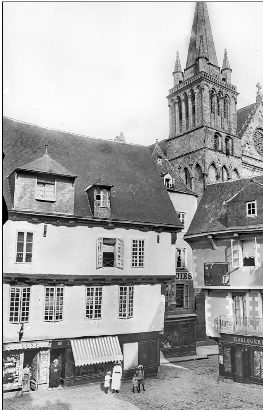
Fig. 7.2. Vannes, 2e quart du XXe s.*