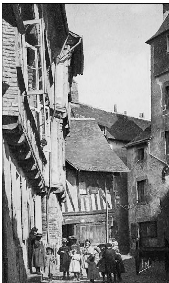
Fig. 7.4. Quimperlé (carte postale Ed. Laurent-Neil)*