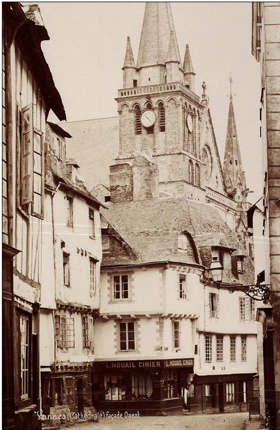
Vannes (Cathédrale) façade Ouest