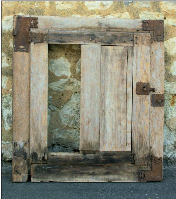
Fig. 1.1. Elévation intérieure