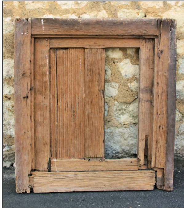
Fig. 1.2. Elévation extérieure