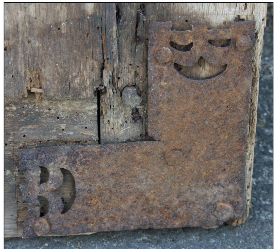
Fig. 1.7. Equerre