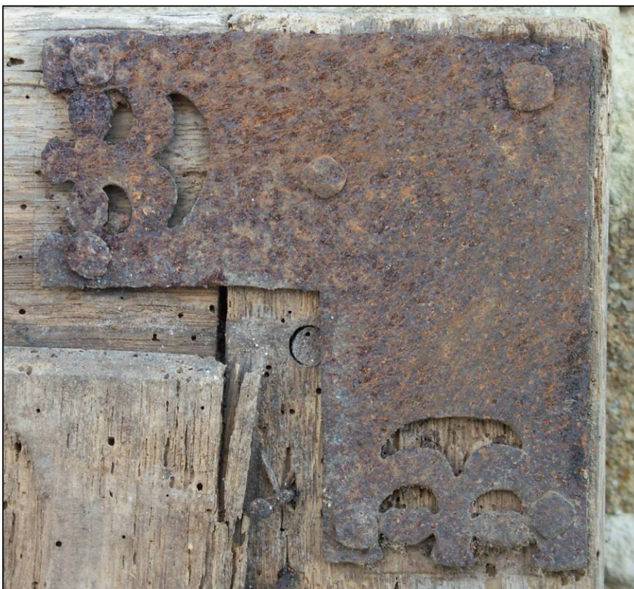
Fig. 1.6. Equerre