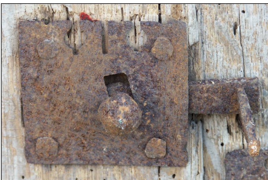
Fig. 1.4. Loquet