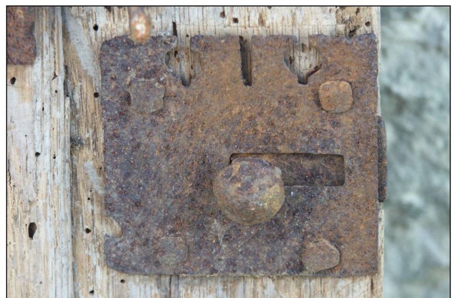
Fig. 1.5. Targette