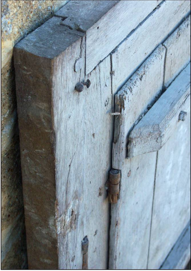
Fig. 2.1. Détail des bâtis