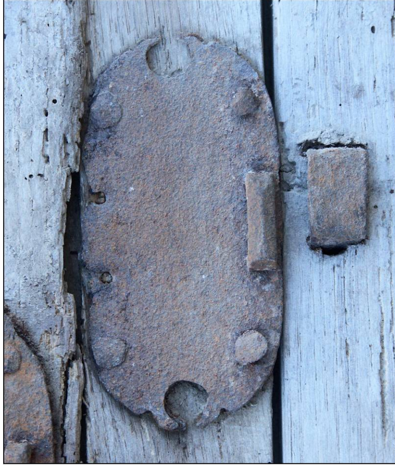
Fig. 2.2. Targette