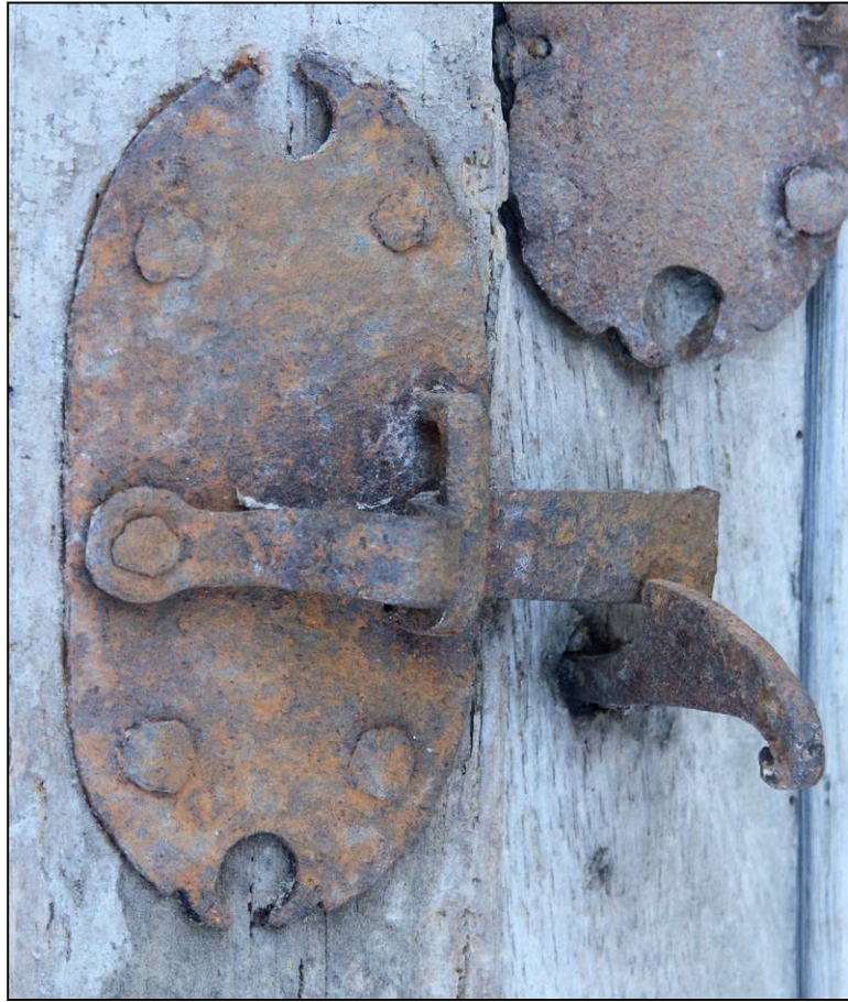
Fig. 2.4. Loquet