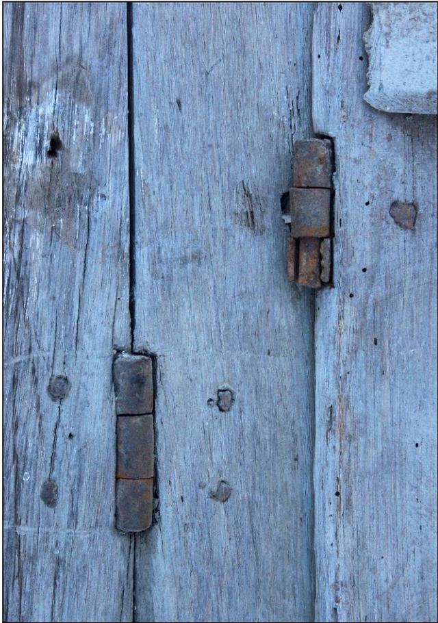
Fig. 2.3. Fiches