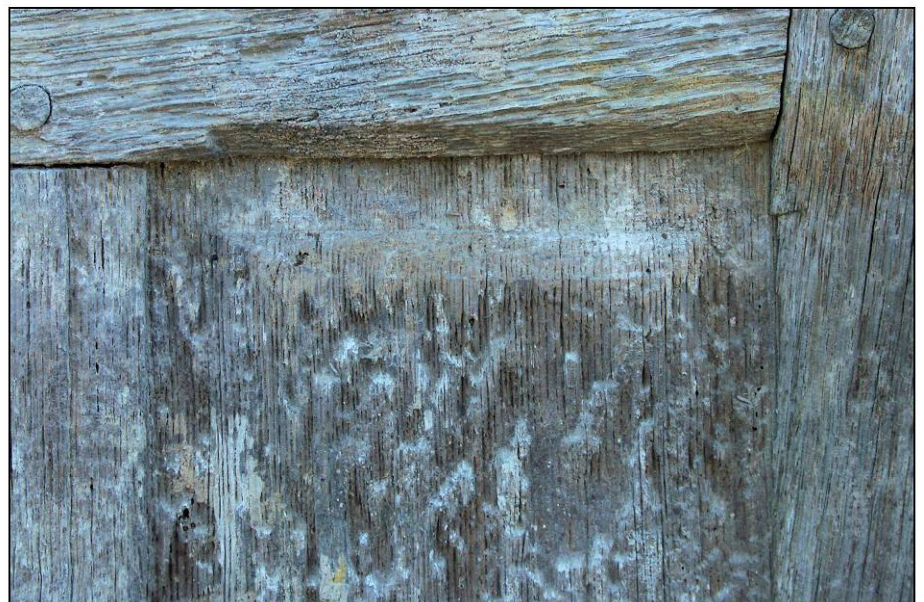
Fig. 2.6. Détail du panneau