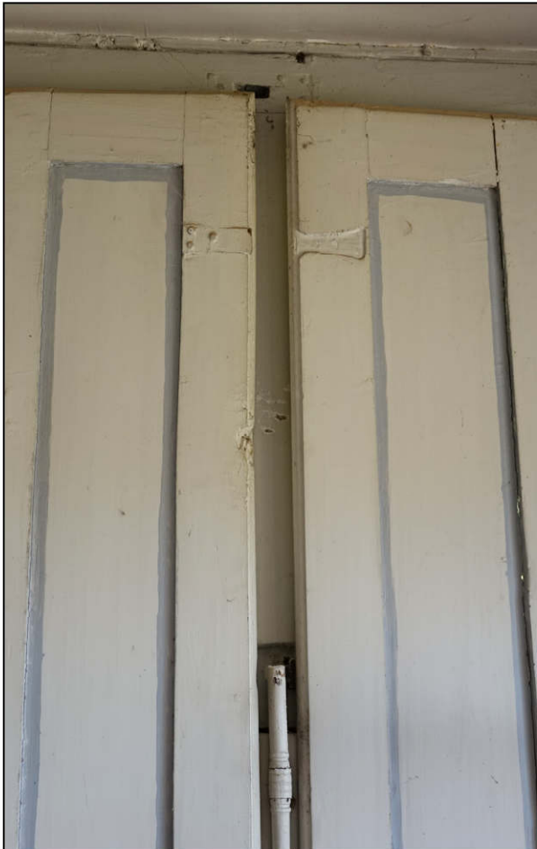
Fig. 5.1. Tringle sectionnée