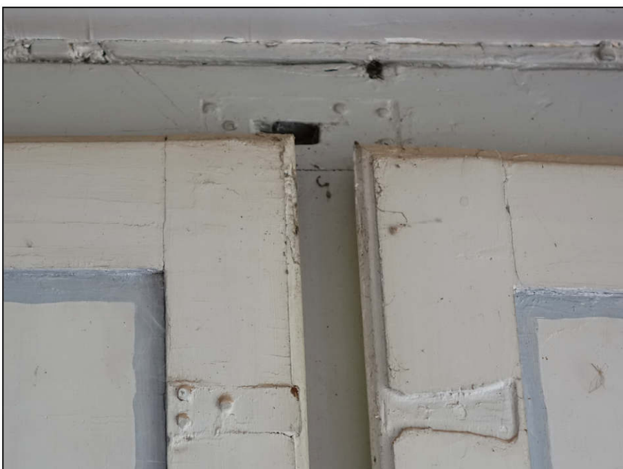
Fig. 5.7. Gâche supérieure Contre-panneton et traces d'une agrafe