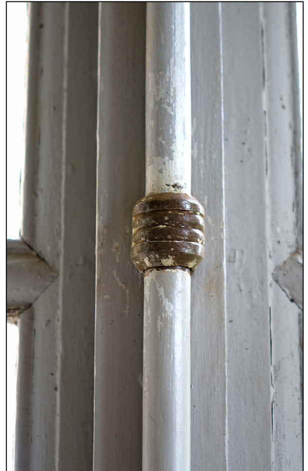
Fig. 5.3. Conduit