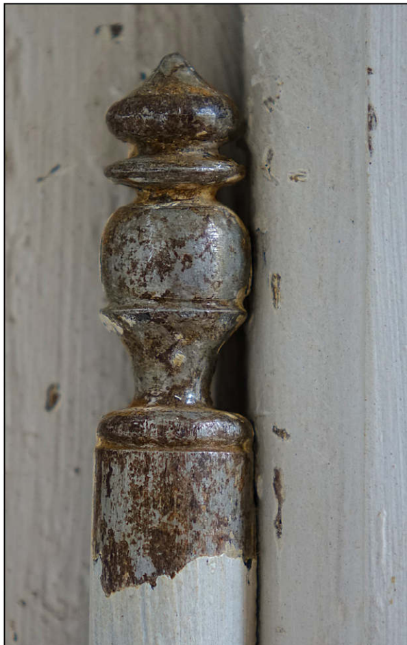
Fig. 5.5. Fiche à vases