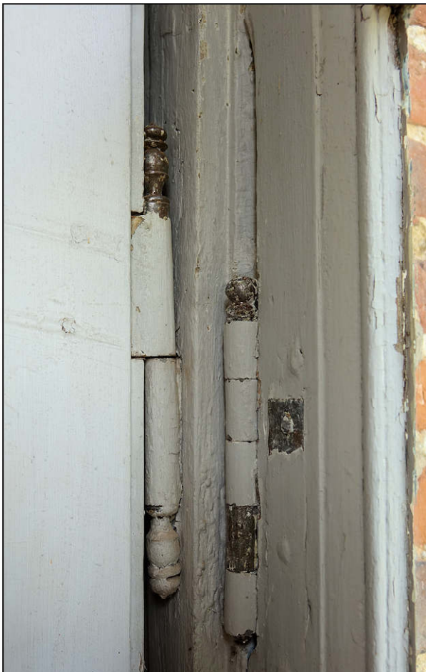
Fig. 5.4. Fiche à vases et fiche à bouton