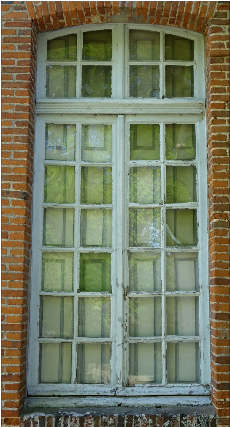
Fig. 3.1. Elévation extérieure