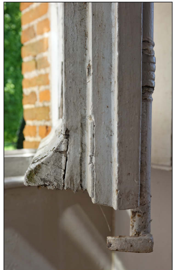
Fig. 3.6. Jet d'eau