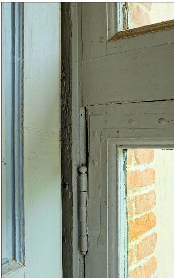
Fig. 3.4. Fiche à bouton et équerre