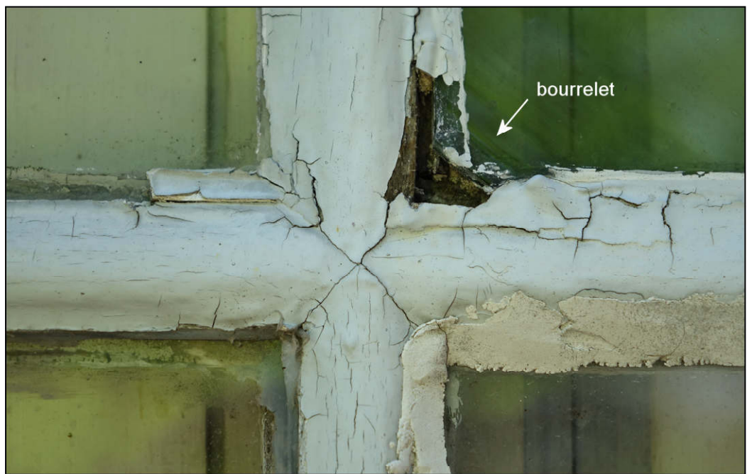
Fig. 3.3. Assemblage des petits-bois