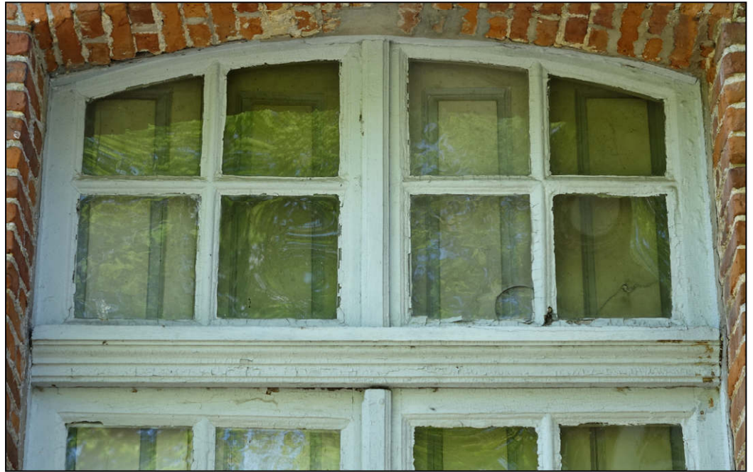
Fig. 3.2. Imposte