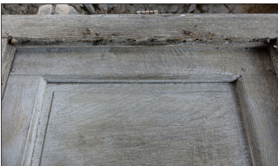
Fig. 5.6. Compartiment vitré supérieur (3)