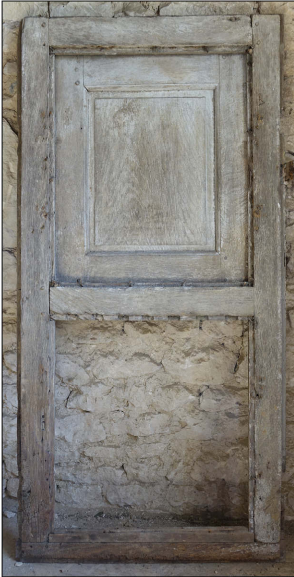
Fig. 5.1. Elévation extérieure (3)