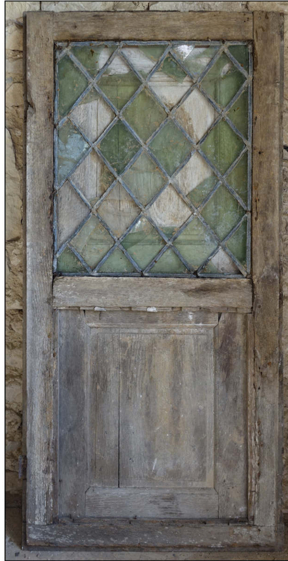
Fig. 5.2. Elévation extérieure (4)