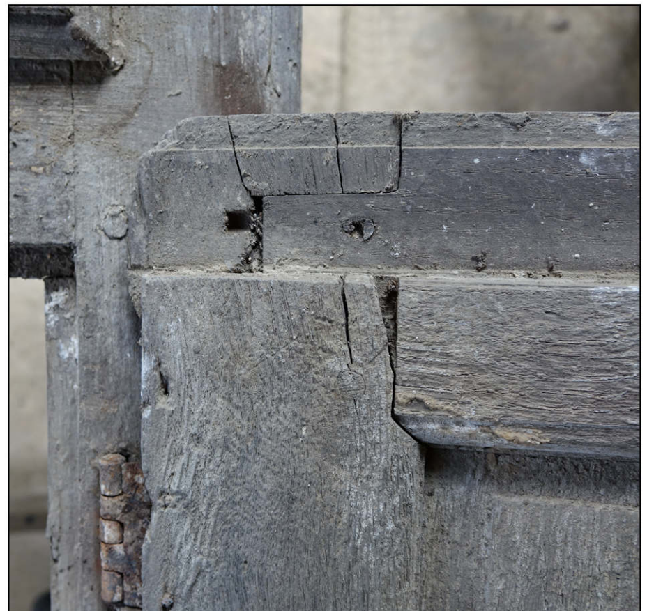
Fig. 5.5. Volet / assemblage (4)