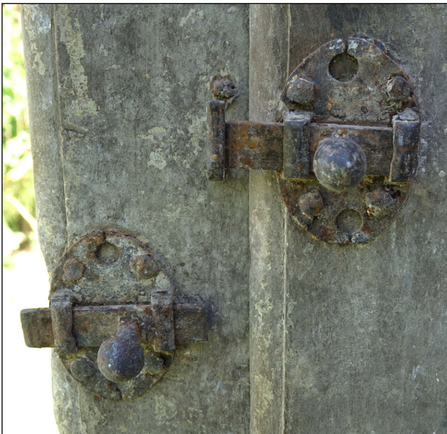
Fig. 5.4. Targettes (4)