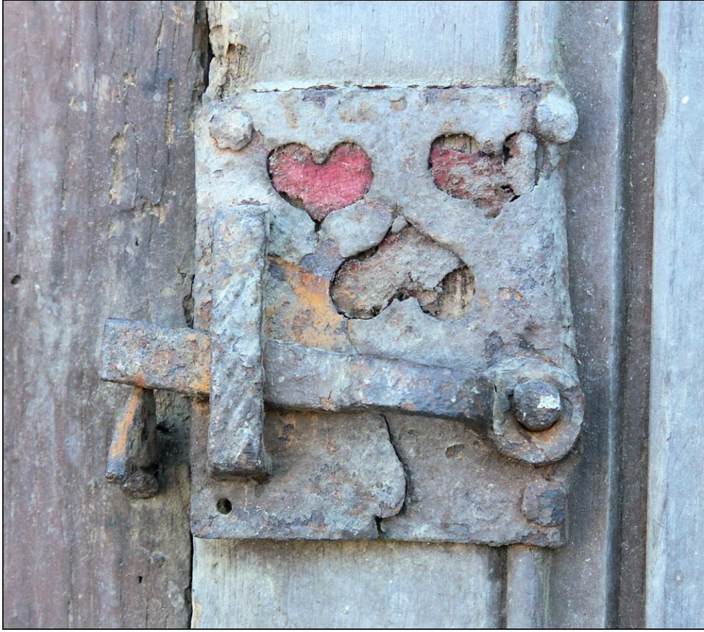
Fig. 5.1. Loquet (volet supérieur droit)