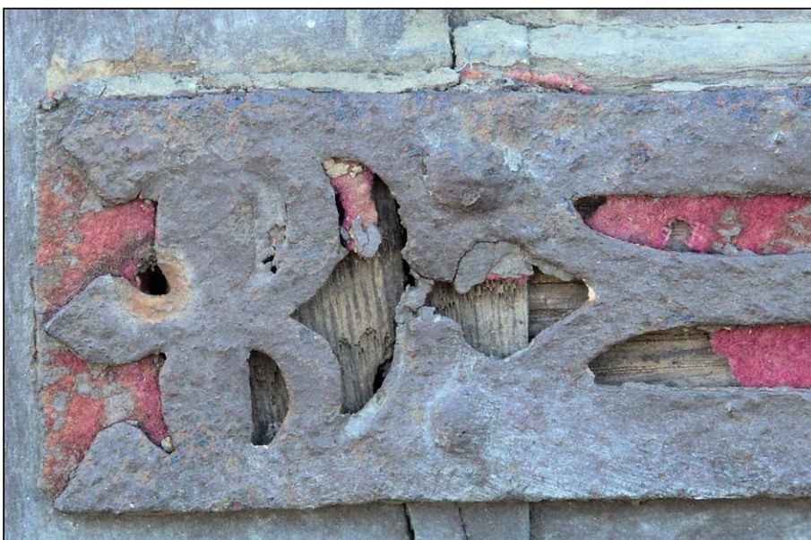
Fig. 5.5. Charnière (about)