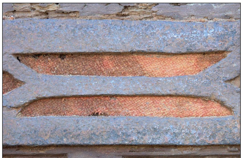
Fig. 5.6. Charnière (ajours)