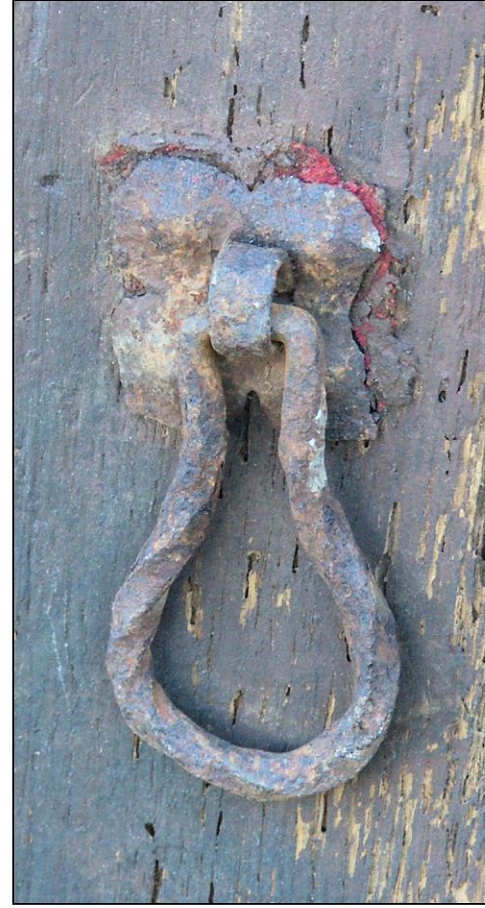
Fig. 5.2. Poignée en boucle