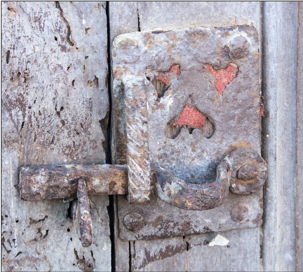
Fig. 5.3. Loquet (volet intermédiaire droit)