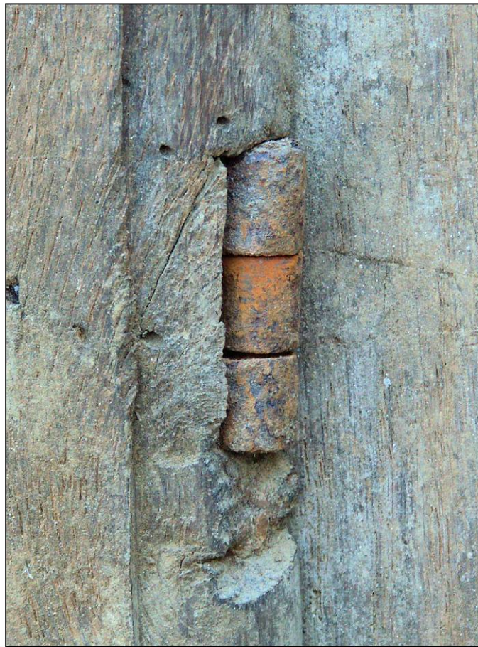
Fig. 2.4. Fiche à broche rivée