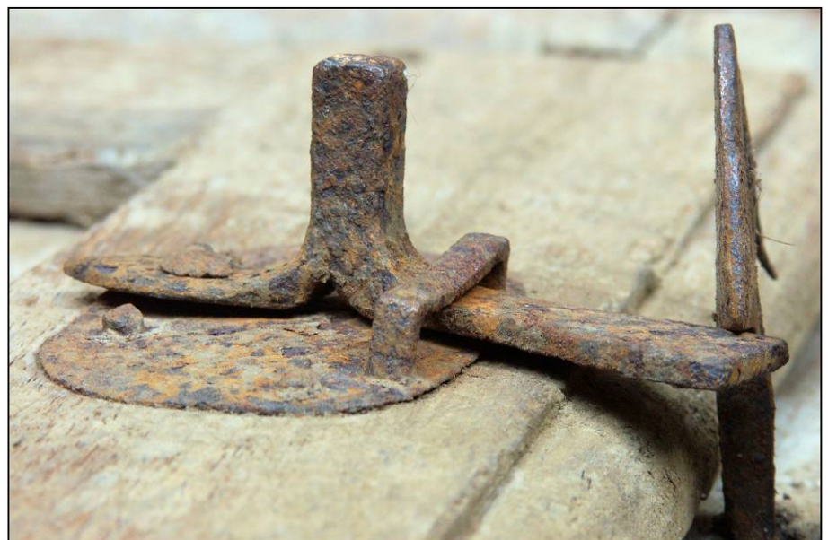
Fig. 2.6. Loquet et mentonnet