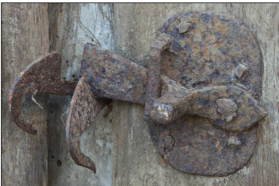
Fig. 2.5. Loquet et mentonnet