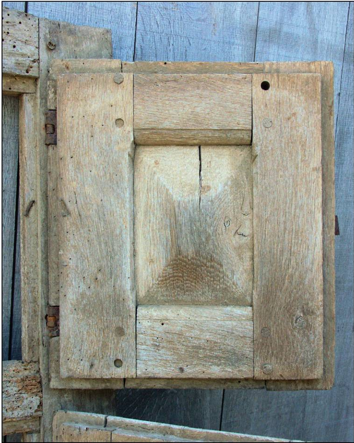
Fig. 2.1. Volet supérieur droit / élévation extérieure