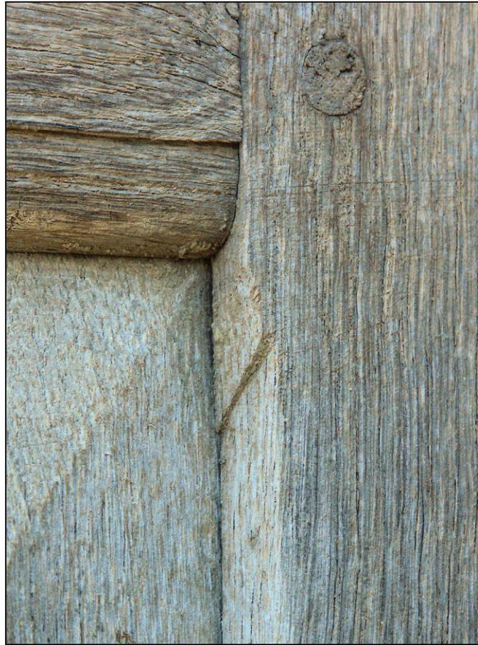
Fig. 2.2. Raccord des moulures