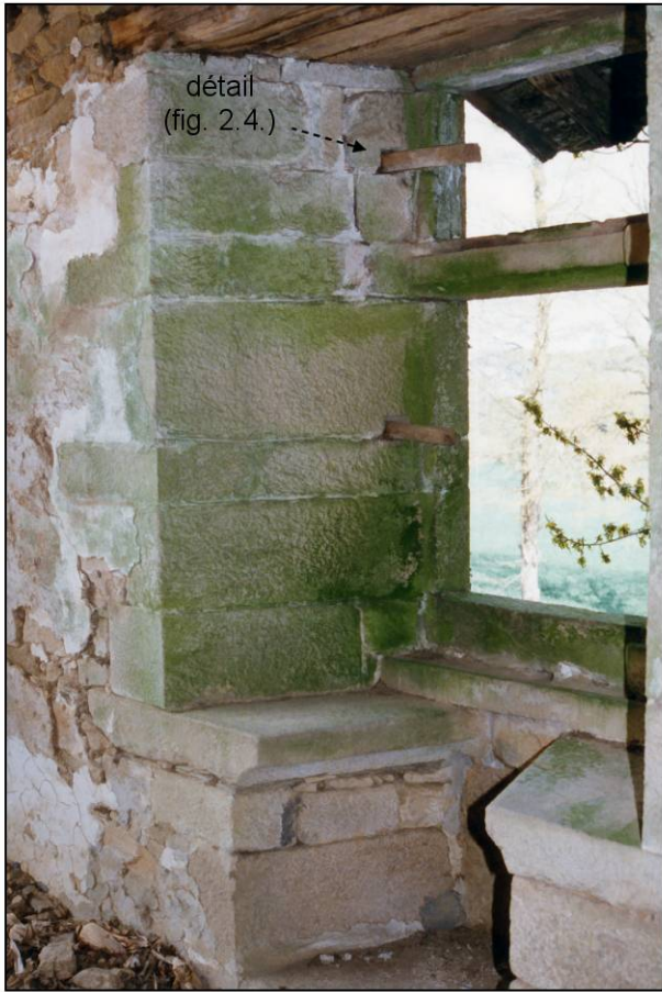
Fig. 2.1. Demi-croisée A / ébrasement gauche