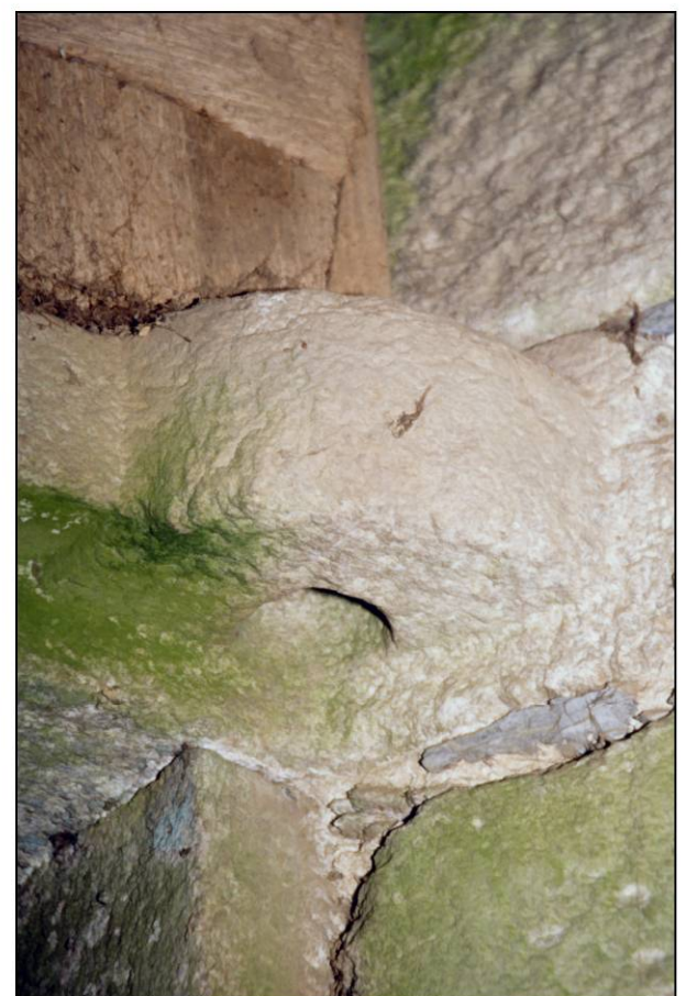
Fig. 2.6. Crapaudine / traverse