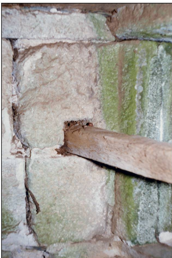
Fig. 2.4. Coulisse / compartiment supérieur