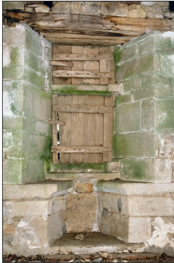
Fig. 2.2. Demi-croisée A / élévation intérieure