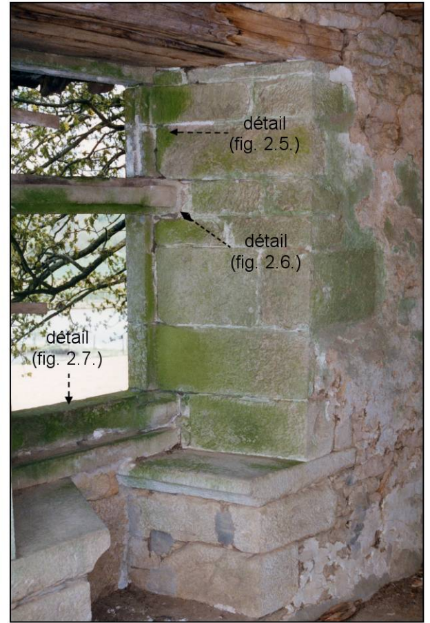
Fig. 2.3. Demi-croisée A / ébrasement droit