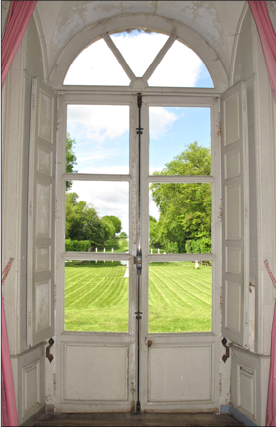
Fig. 7.1. Elévation intérieure