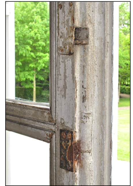
Fig. 7.4. Verrou et gâche