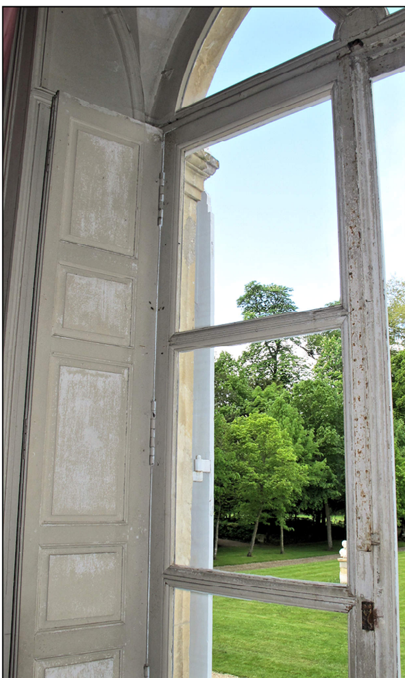
Fig. 7.5. Vantail vitré gauche