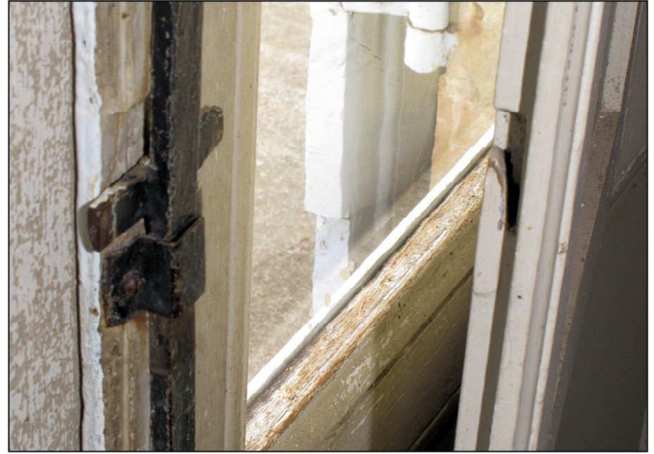
Fig. 7.2. Pannetons de fermeture des volets