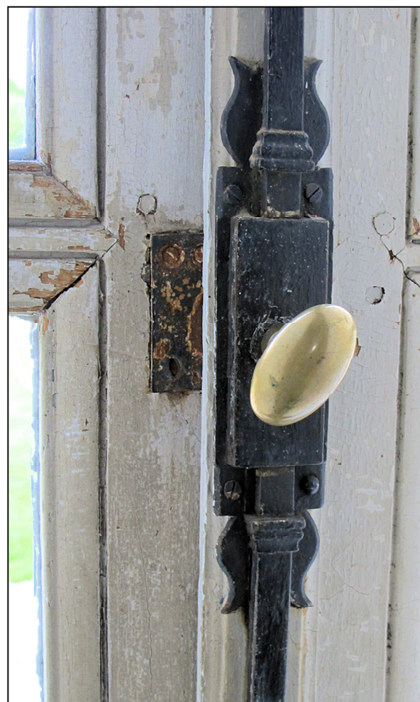
Fig. 7.6. Poignée de crémone