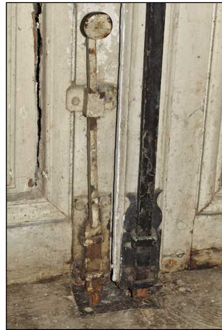
Fig. 7.3. Verrou et crémone