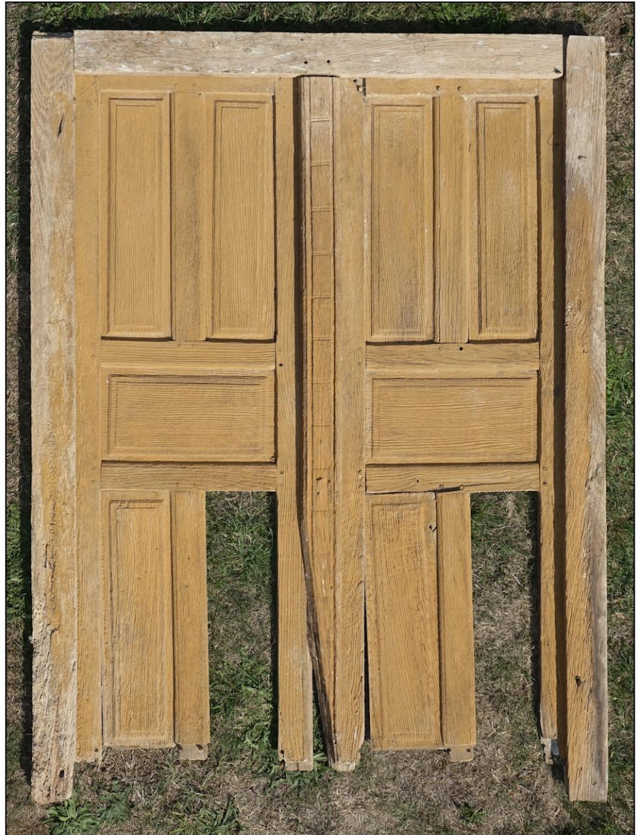
Fig. 5.2. Elévation extérieure