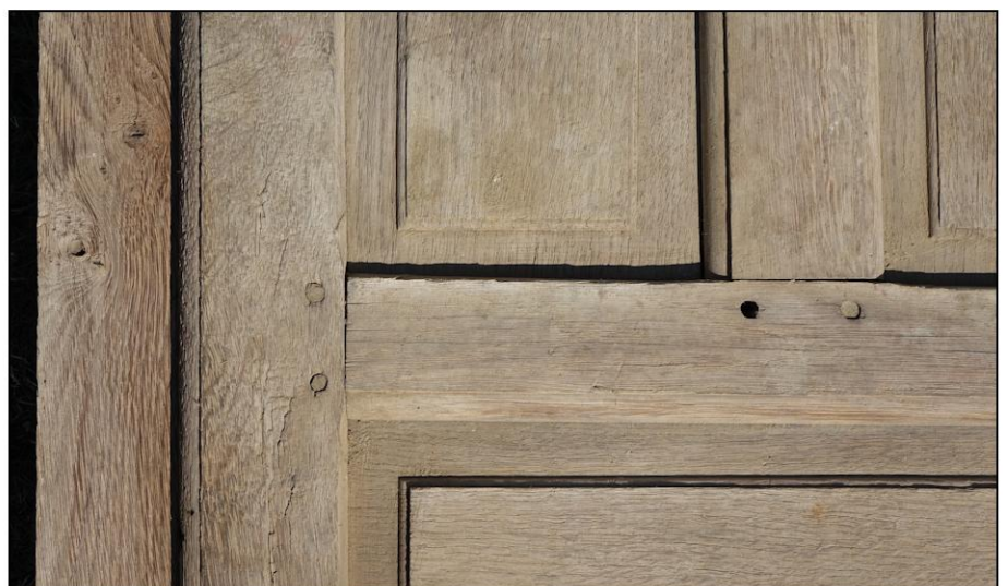
Fig. 5.5. Elévation intérieure (détail)