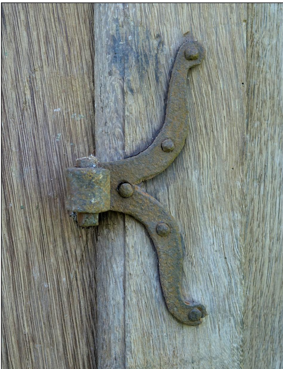
Fig. 5.3. Paumelle