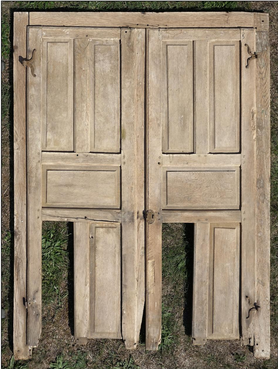
Fig. 5.1. Elévation intérieure