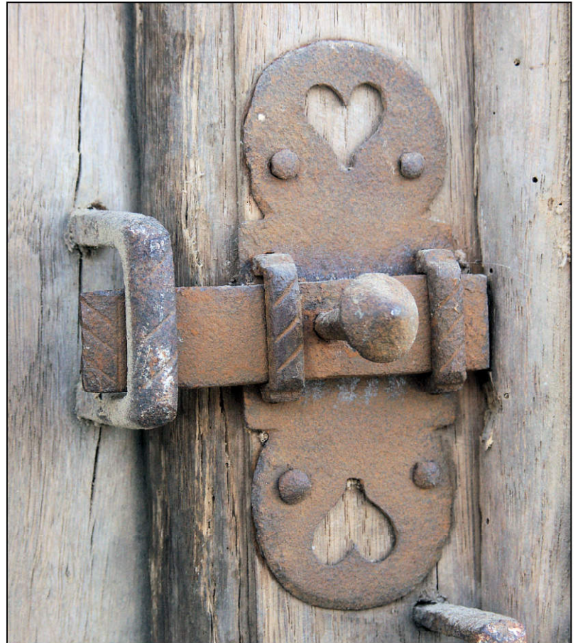
Fig. 1.2. Targette