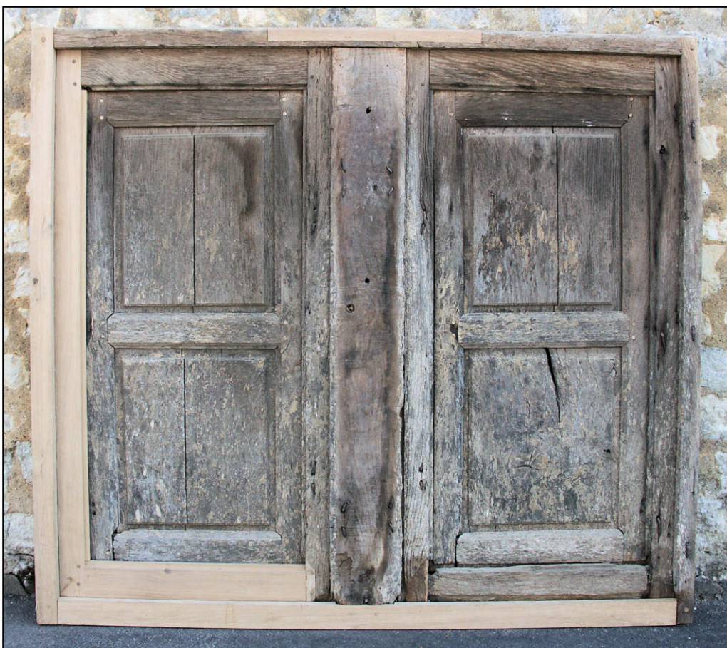
Fig. 1.3. Elévation extérieure