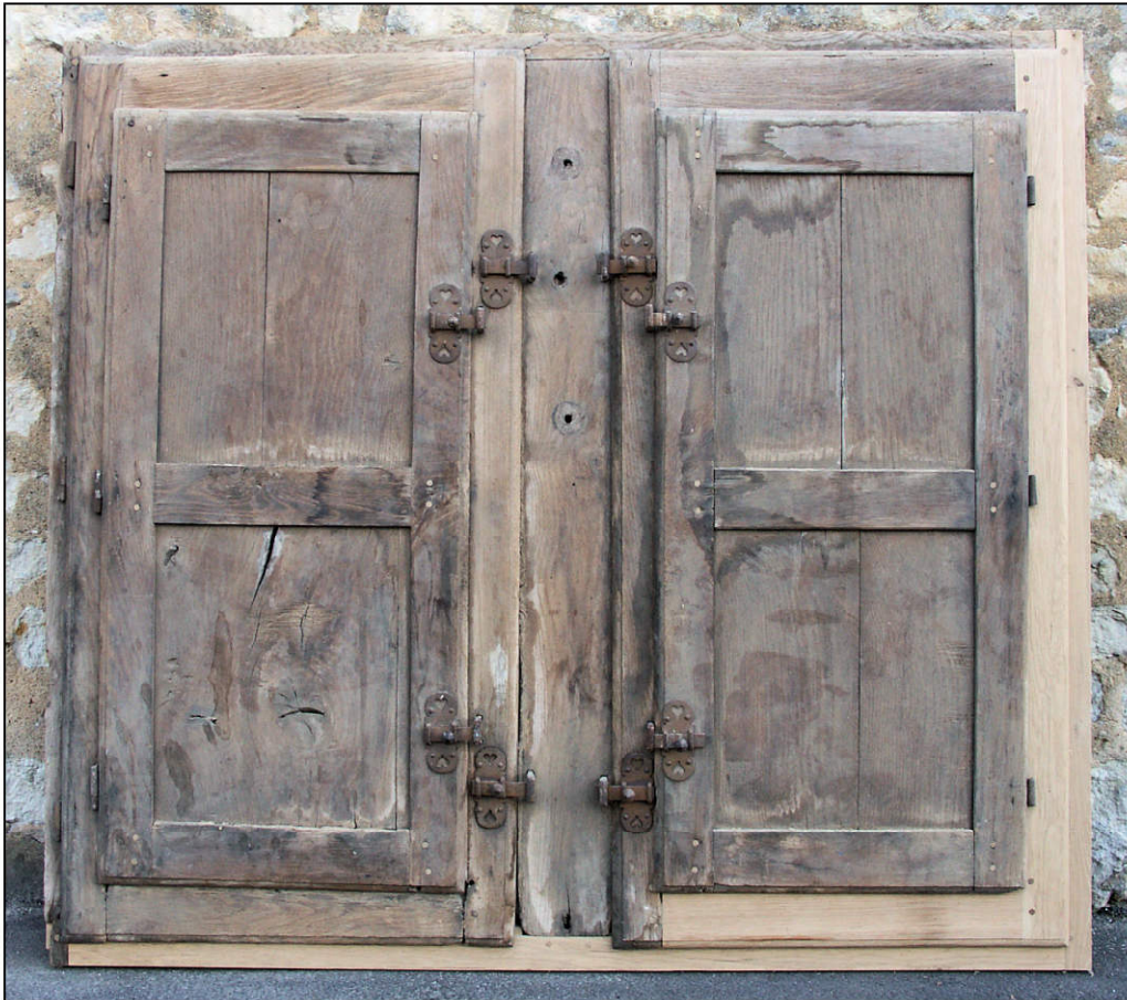
Fig. 1.1. Elévation intérieure