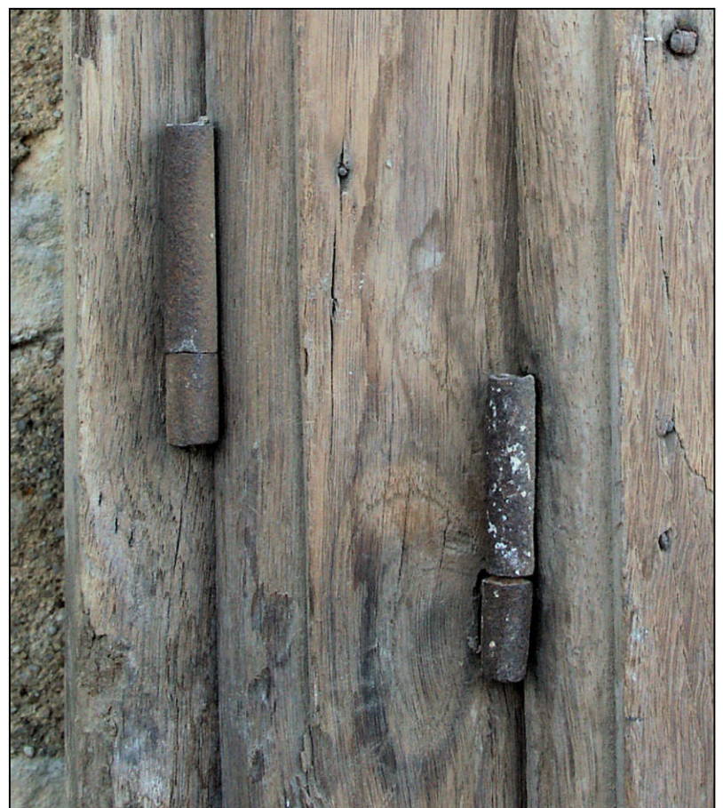
Fig. 1.4. Fiches à gond