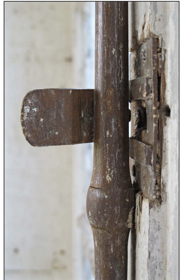
Fig. 7.6. Fermeture des volets