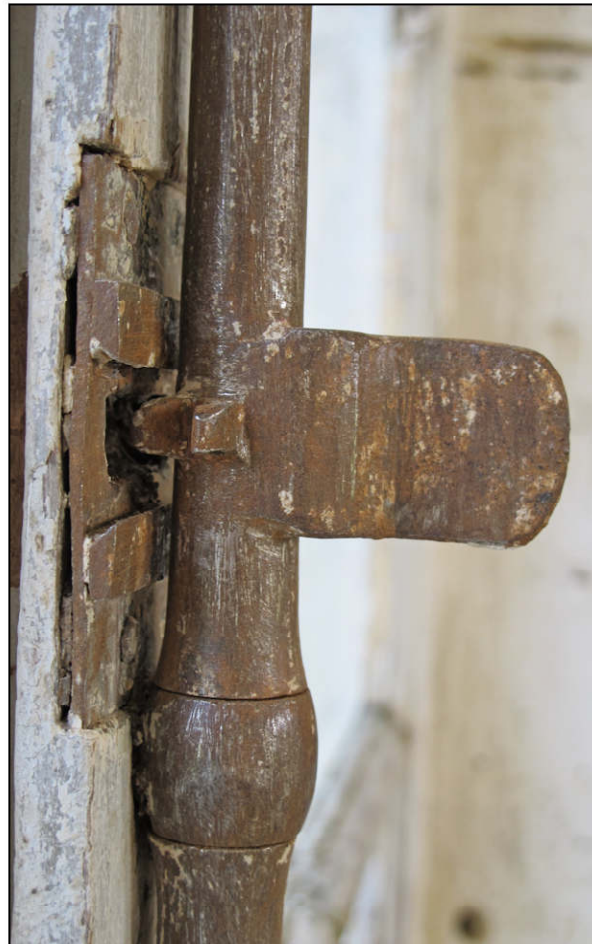
Fig. 7.5. Fermeture des volets