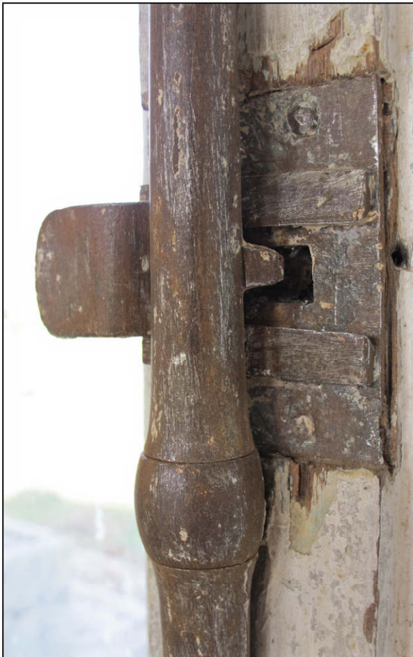
Fig. 7.4. Fermeture des volets