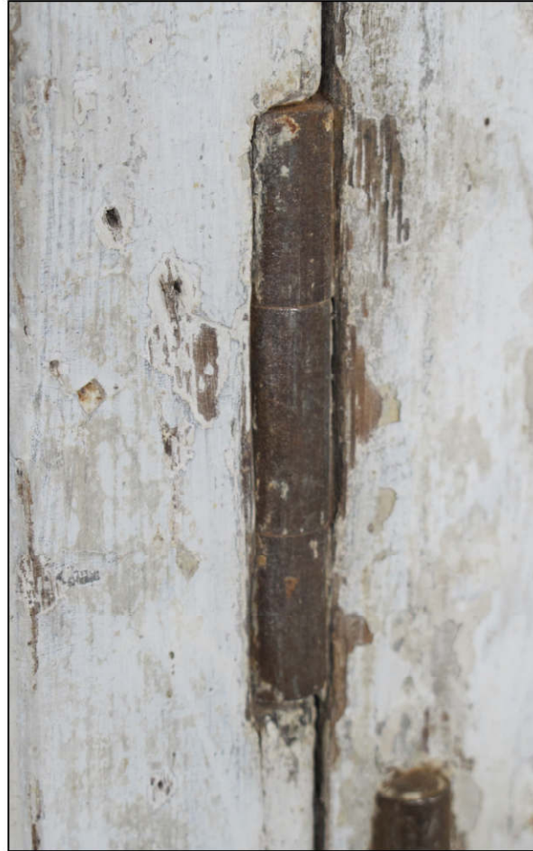
Fig. 7.2. Fiche (vantail vitré)