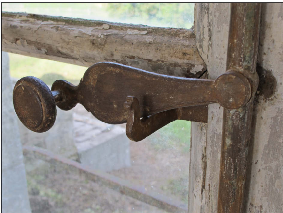
Fig. 7.7. Poignée d'espagnolette