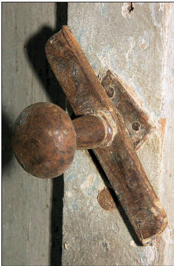
Fig. 2.5. Tourniquet