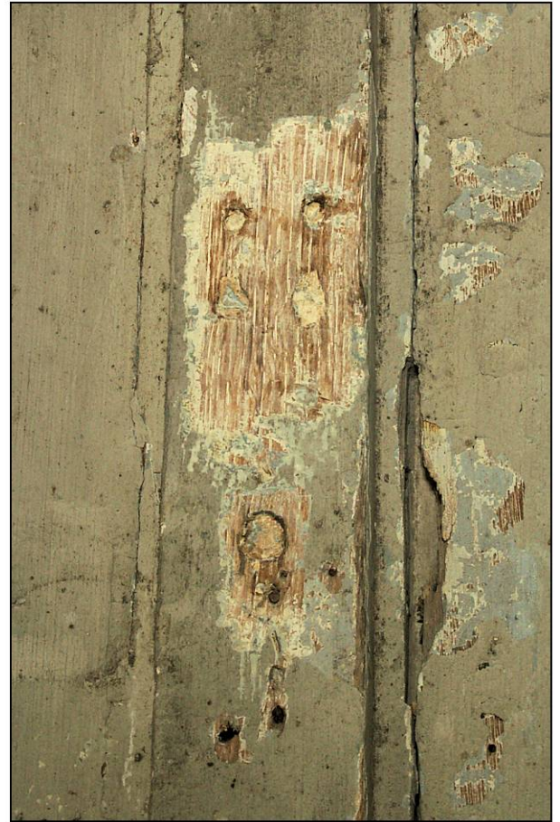
Fig. 2.3. Meneau sup. (traces mentonnets / tourniquet)