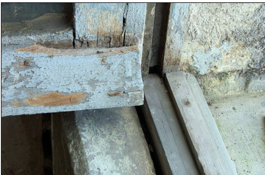
Fig. 2.7. Pièce d'appui