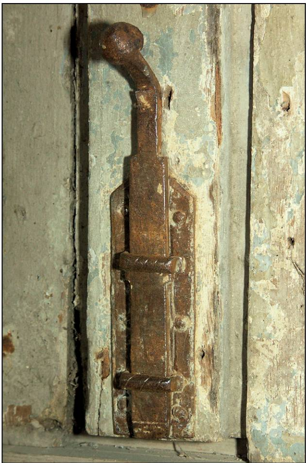
Fig. 2.4. Verrou inférieur