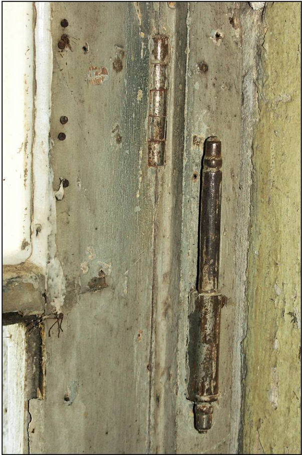
Fig. 2.1. Fiches