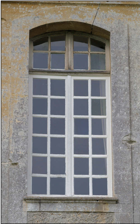
Fig. 3.1. Fenêtre