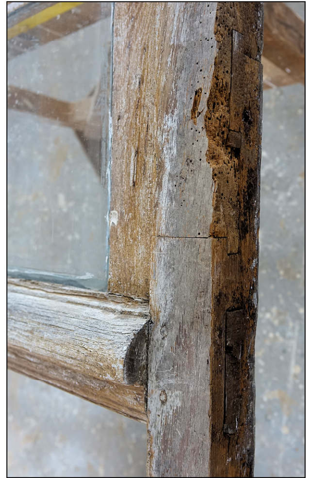
Fig. 3.3. Traverse d'imposte