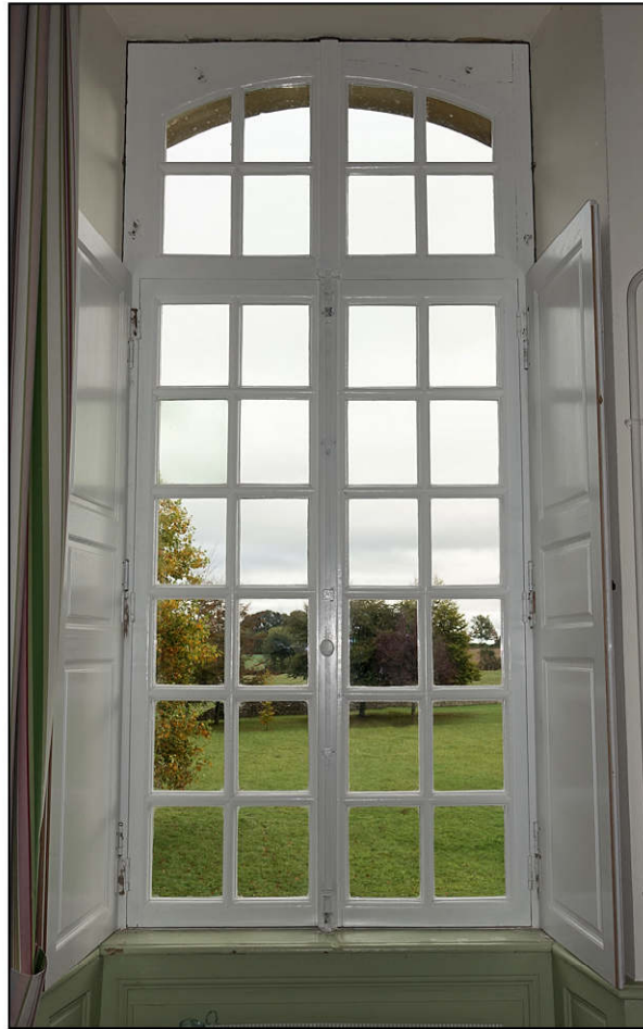
Fig. 3.2. Croisée