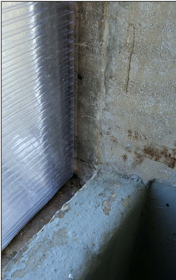
Fig. 3.4. Allège (appui)