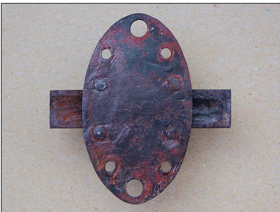
Fig. 3.7. Targette de volet (revers)