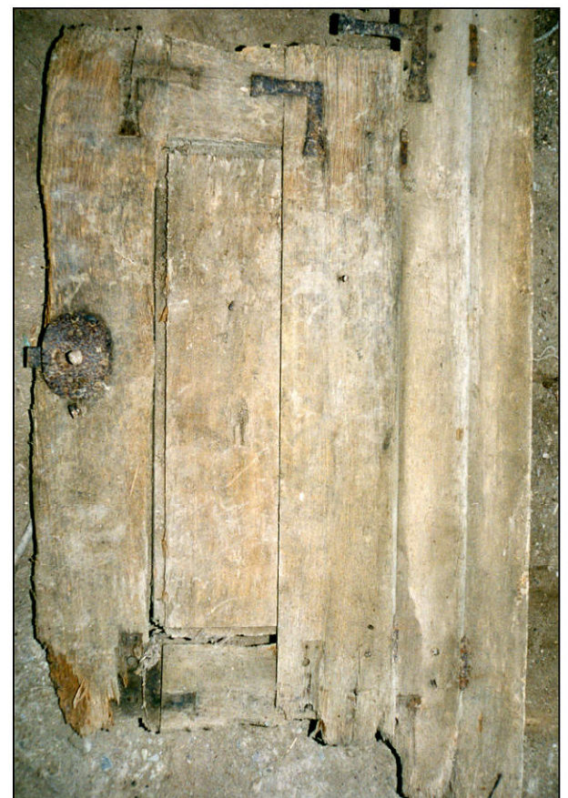
Fig. 2.6. Volet inférieur droit (intérieur)