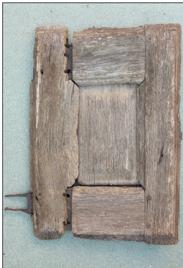
Fig. 2.5. Volet intermédiaire droit (extérieur)