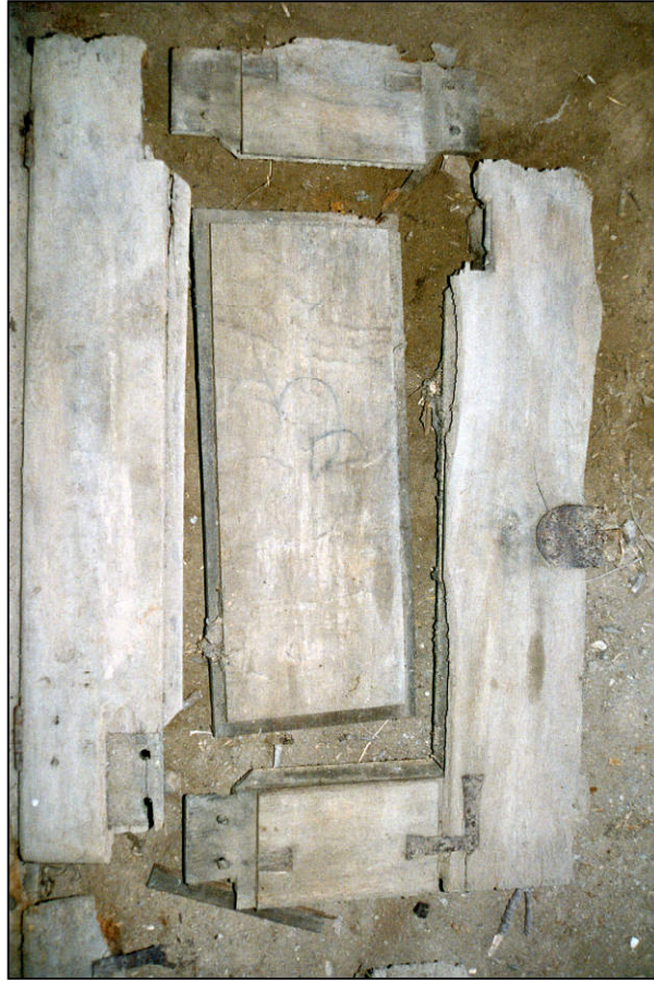
Fig. 2.2. Volet supérieur gauche (intérieur)