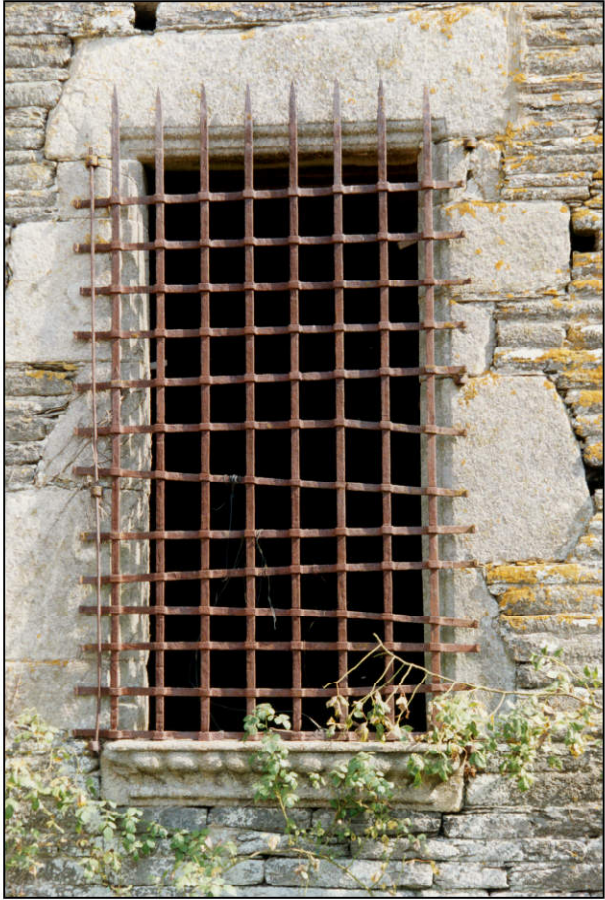
Fig. 2.1. Fenêtre