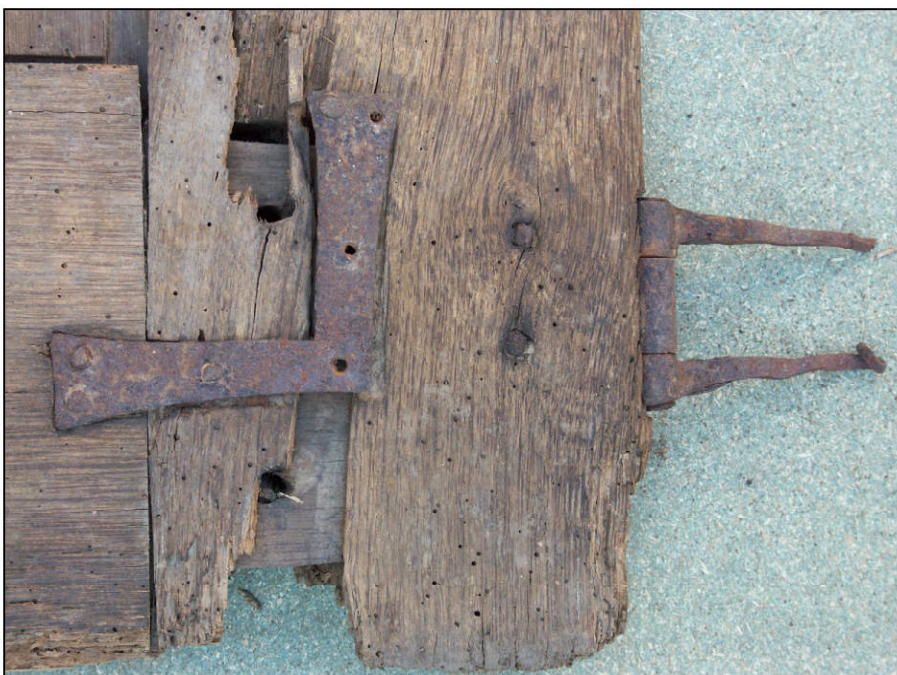
Fig. 2.7. Volet intermédiaire droit (détail)