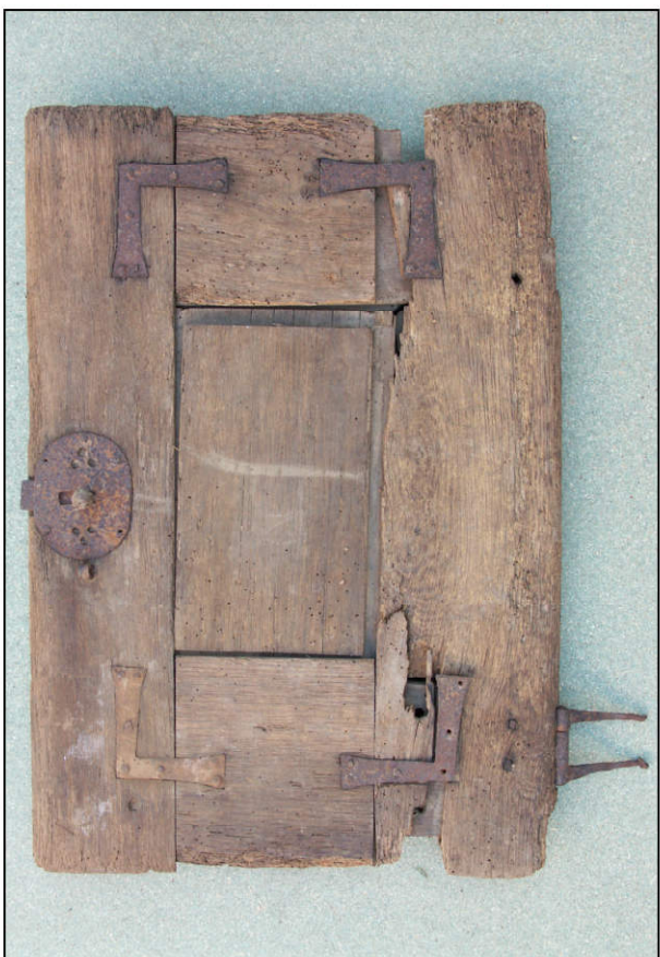
Fig. 2.4. Volet intermédiaire droit (intérieur)