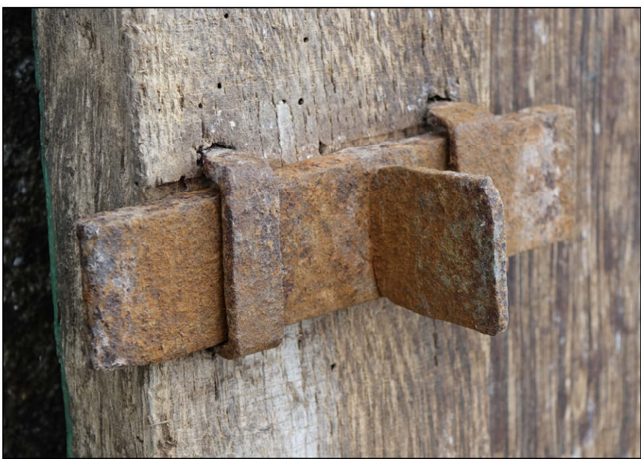
Fig. 4.3. Targette