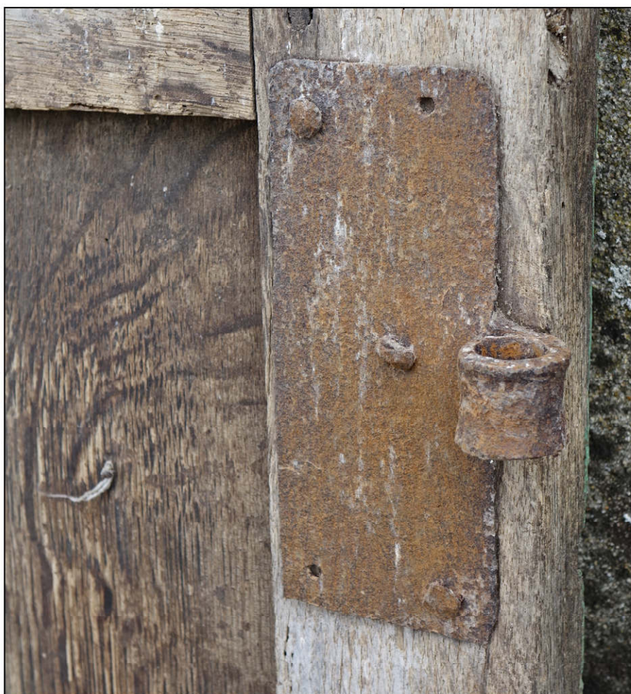
Fig. 4.4. Paumelle supérieure