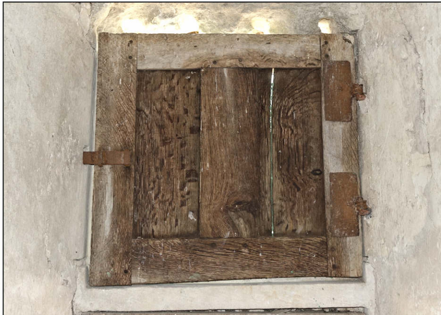
Fig. 4.2. Elévation intérieure