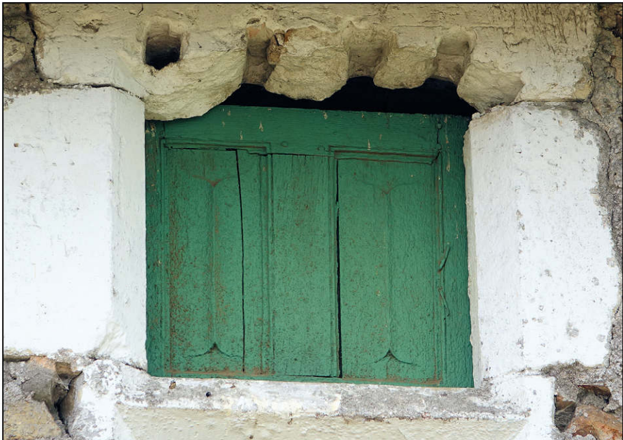
Fig. 4.1. Elévation extérieure