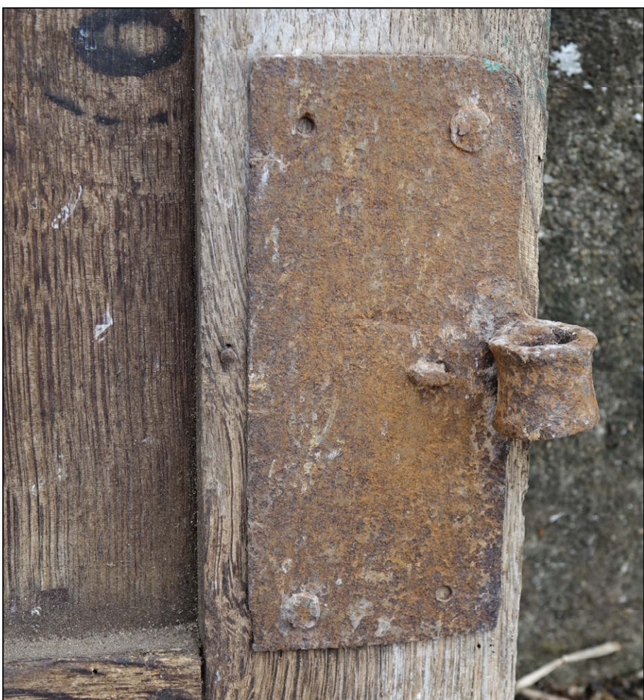
Fig. 4.5. Paumelle inférieure