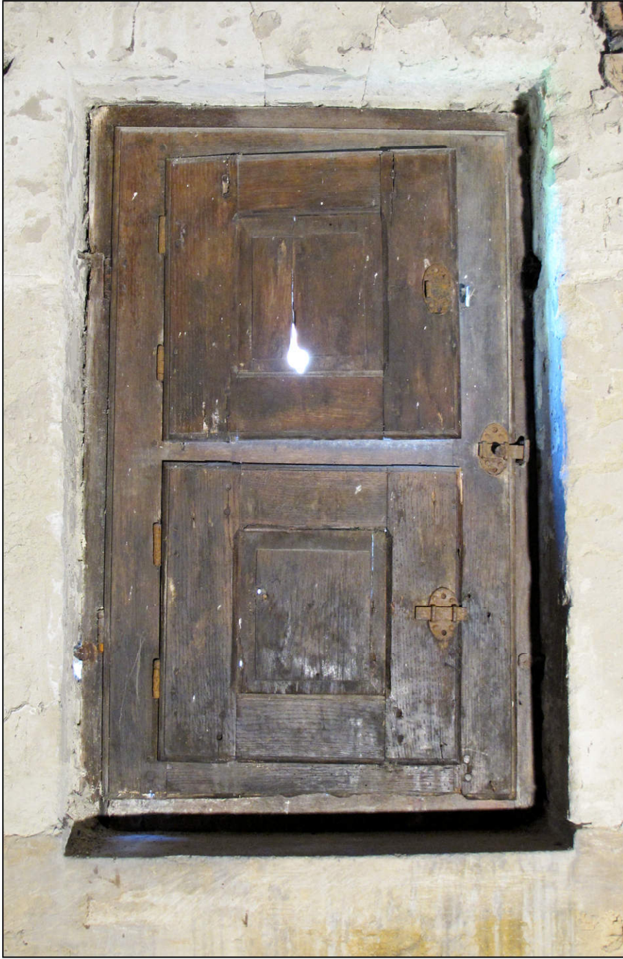
Fig. 2.1. Elévation intérieure