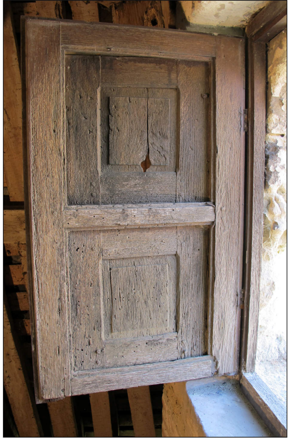
Fig. 2.2. Elévation extérieure