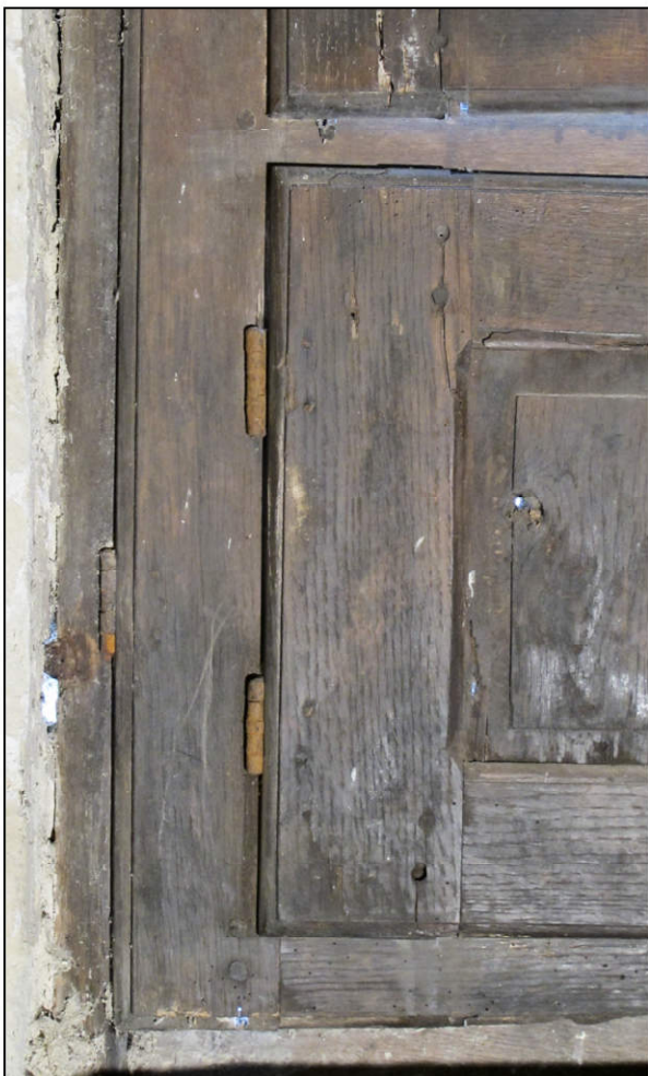
Fig. 2.3. Fiches à broche rivée