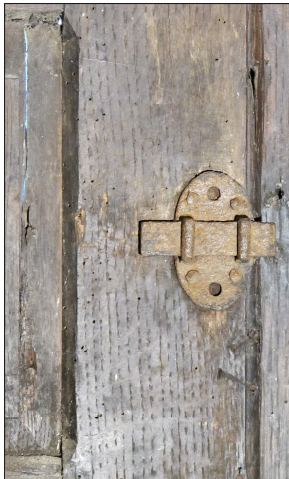
Fig. 2.4. Targette (volet inférieur)