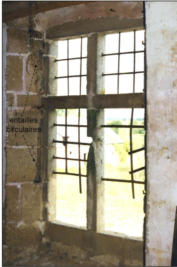
Fig. 1.2. Fenêtre (int. / ébrasement gauche)