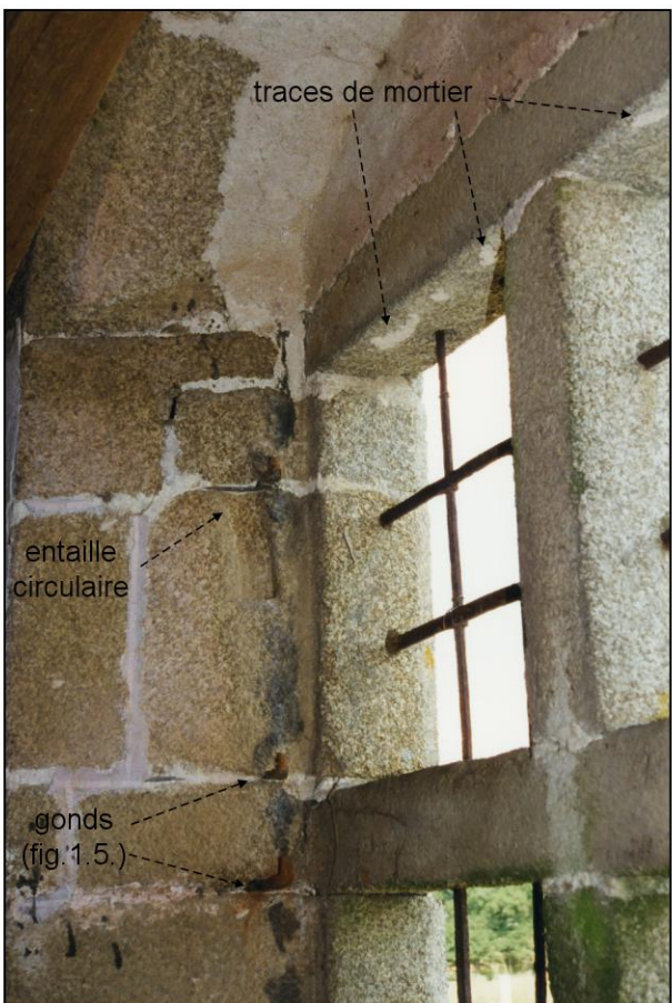
Fig. 1.4. Compartiment sup. gauche (int.)