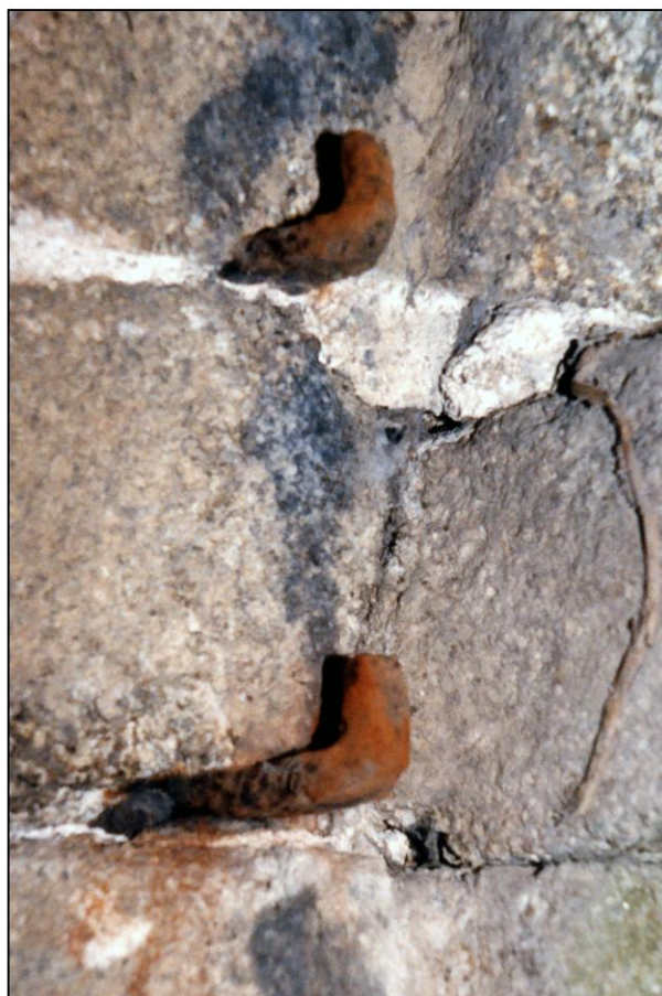
Fig. 1.5. Gonds (ébrasement gauche / croisillon)