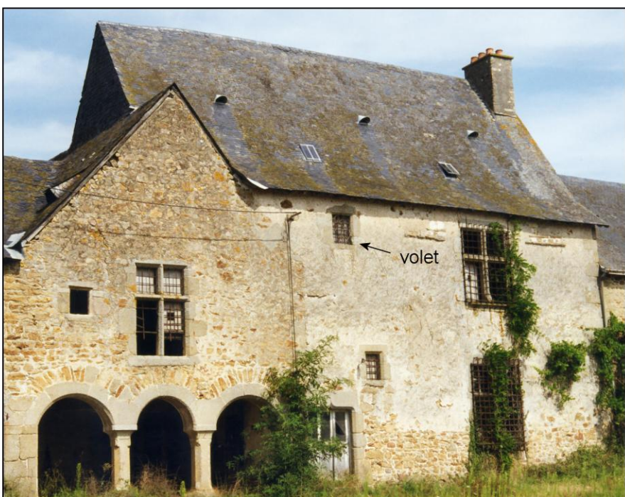
Fig. 1.7. Edifice (façade antérieure) A gauche, l'ancien auditoire de justice A droite, le logis seigneurial (étude n°53006)