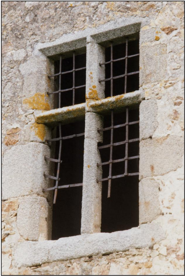
Fig. 1.1. Fenêtre (élévation extérieure)