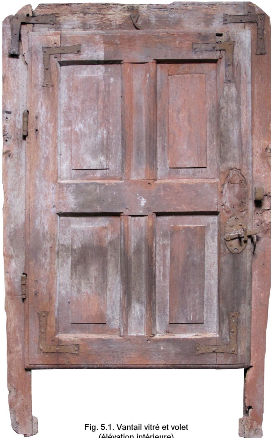
Fig. 5.1. Vantail vitré et volet (élévation intérieure)