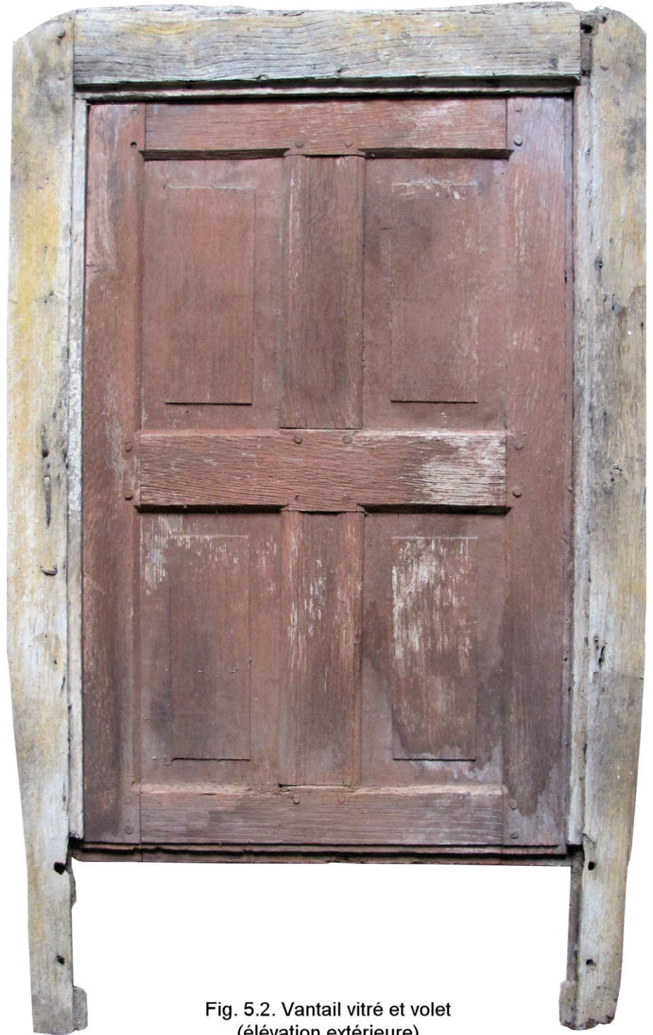
Fig. 5.2. Vantail vitré et volet (élévation extérieure)