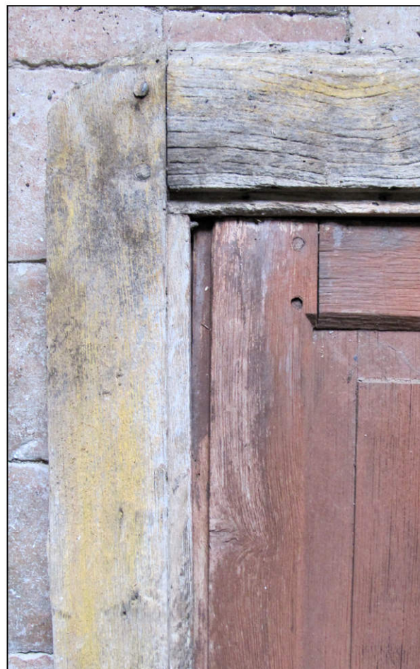
Fig. 5.4. Angle supérieur droit (détail peinture)