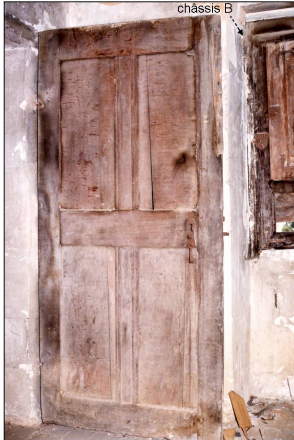
Fig. 4.2. Vantail (pavillon est / 2ème étage)