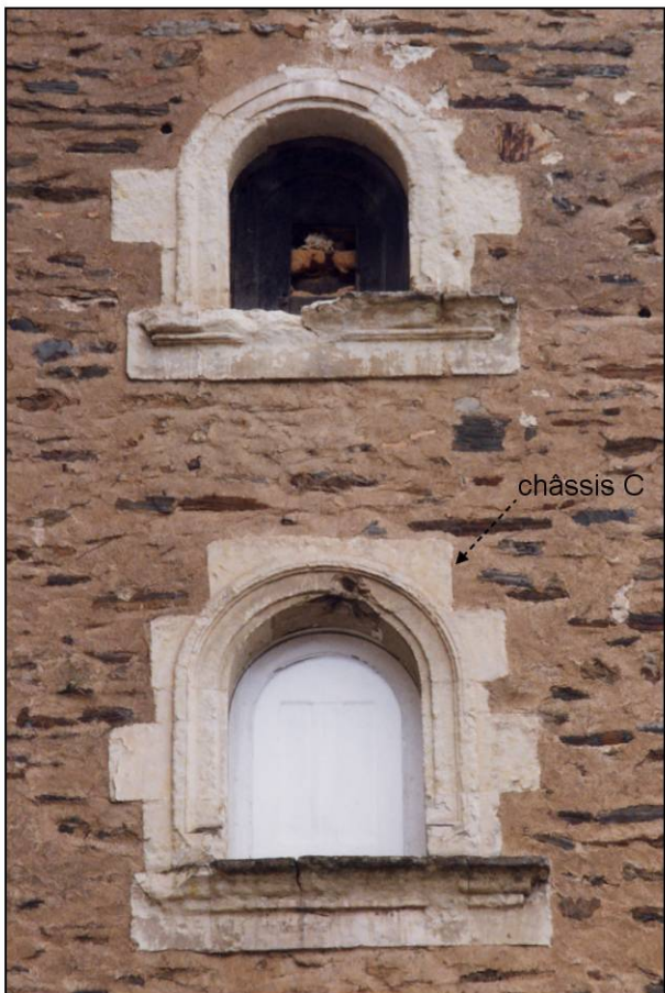
Fig. 4.4. Fenêtres (pavillon nord)