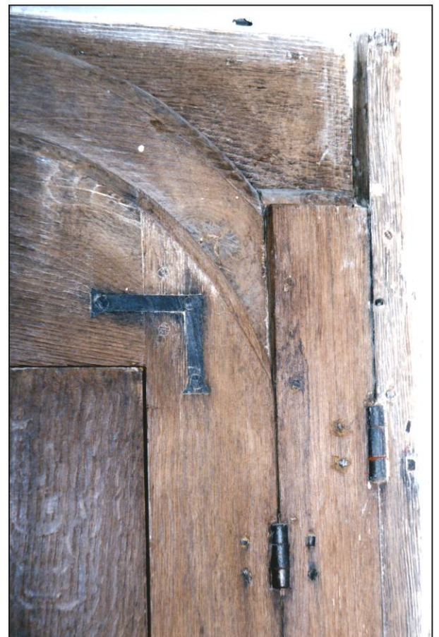
Fig. 4.6. Equerre et fiches (angle sup. droit)