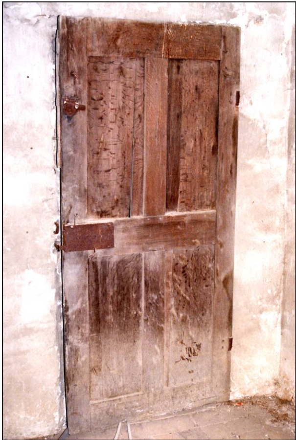
Fig. 4.1. Vantail (pavillon est / 2ème étage)