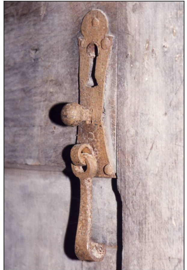
Fig. 4.3. Serrure (vantail / pavillon est)