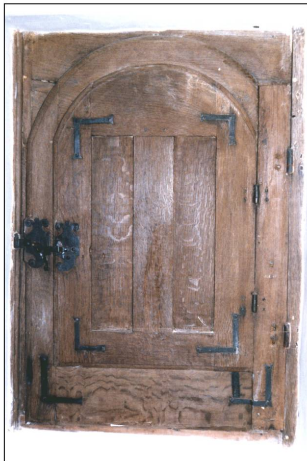
Fig. 4.5. Châssis C (élévation intérieure)