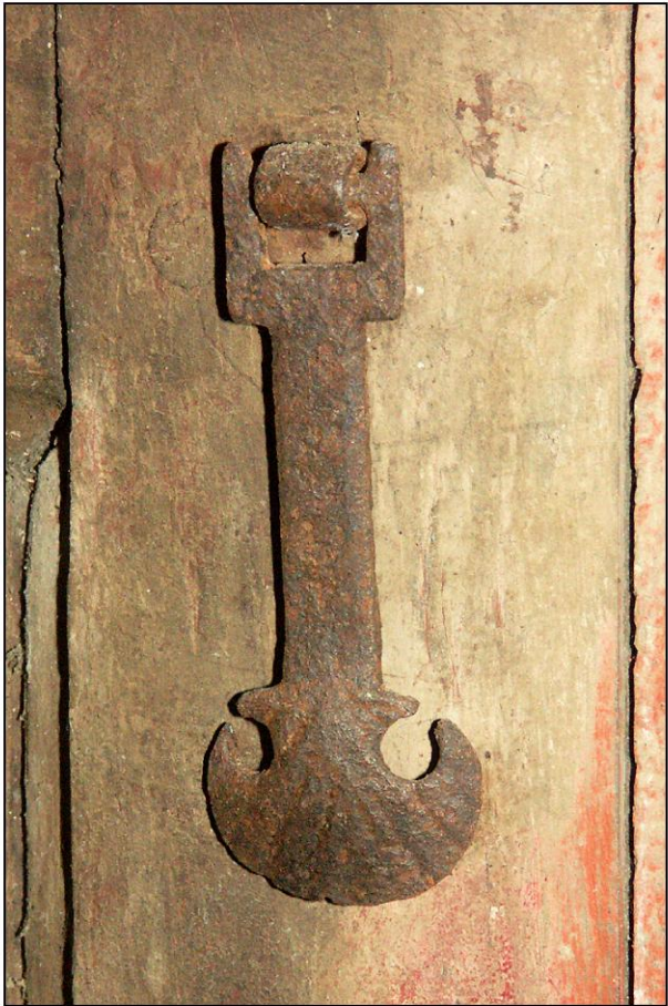
Fig. 4.1. Pendeloque