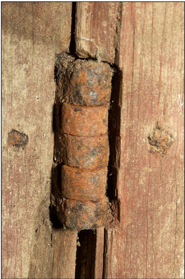
Fig. 4.3. Fiche (volet inférieur)