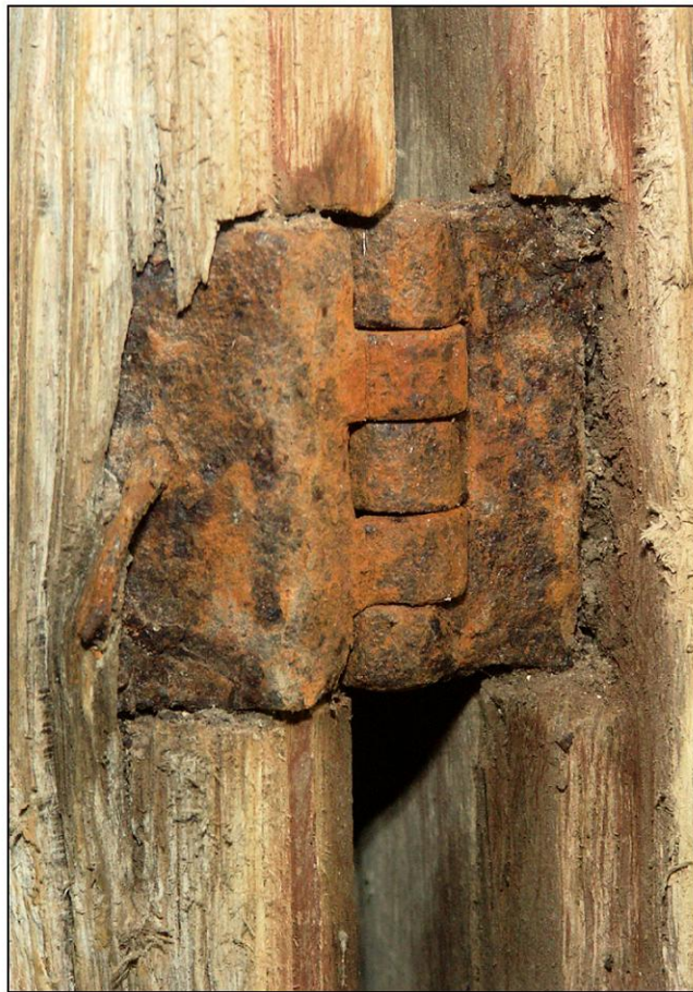
Fig. 4.4. Fiche (volet inférieur)