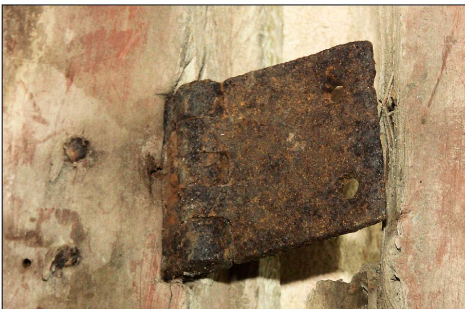
Fig. 4.5. Fiche (volet supérieur)