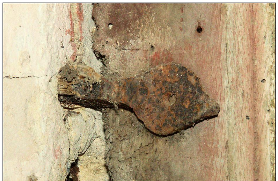
Fig. 4.6. Patte