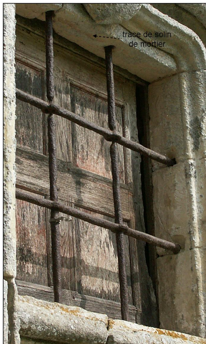
Fig. 1.4. Compartiment supérieur gauche