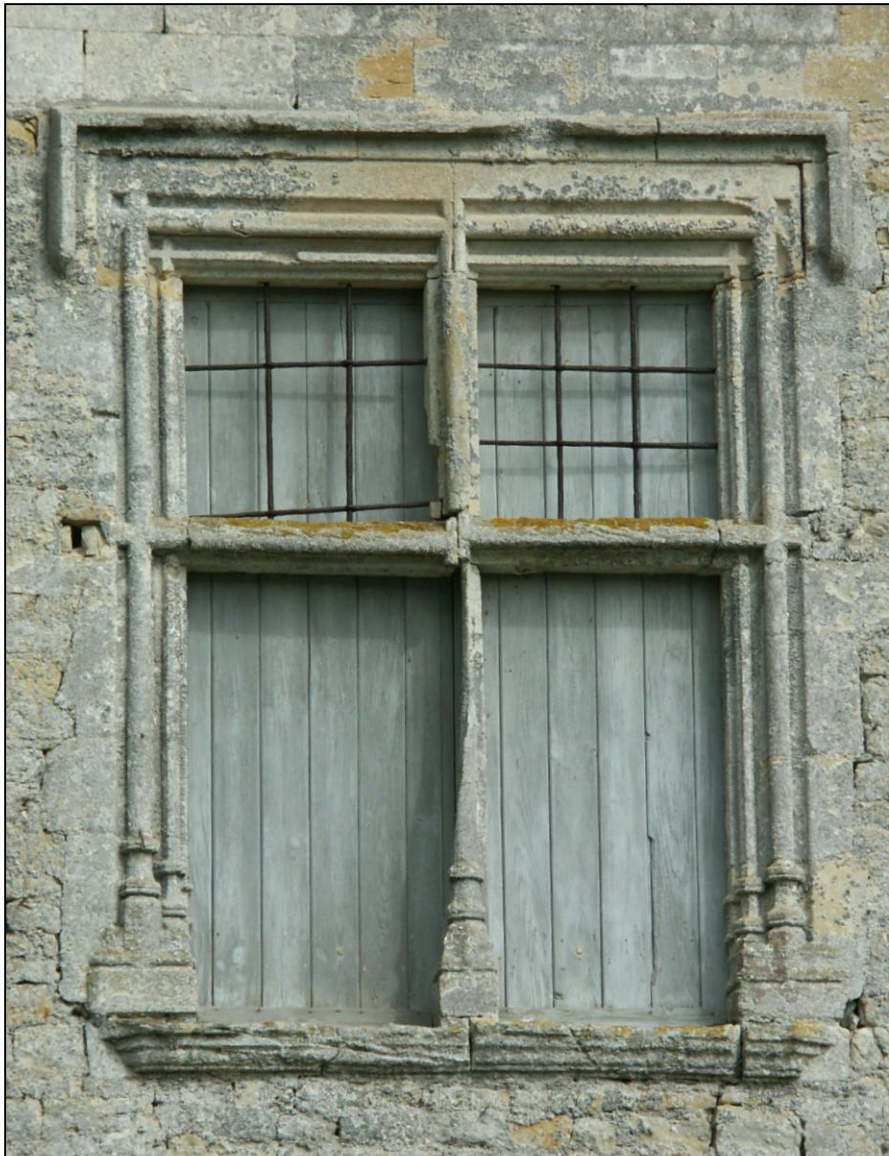
Fig. 1.1. Croisée d'étage