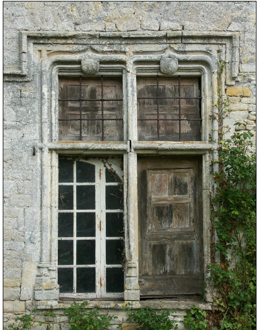
Fig. 1.2. Croisée du rez-de-chaussée