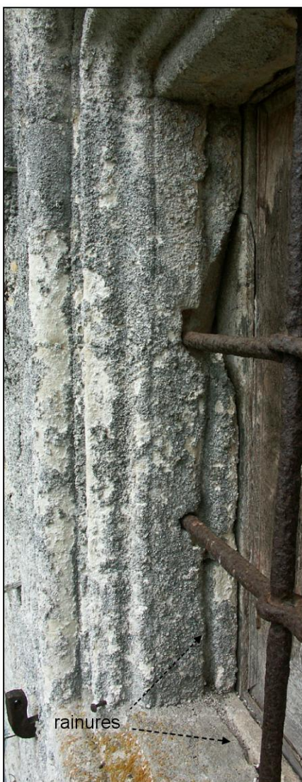
Fig. 1.3. Compartiment sup. droit