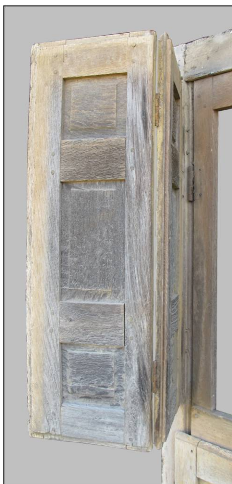
Fig. 1.4. Volet supérieur gauche