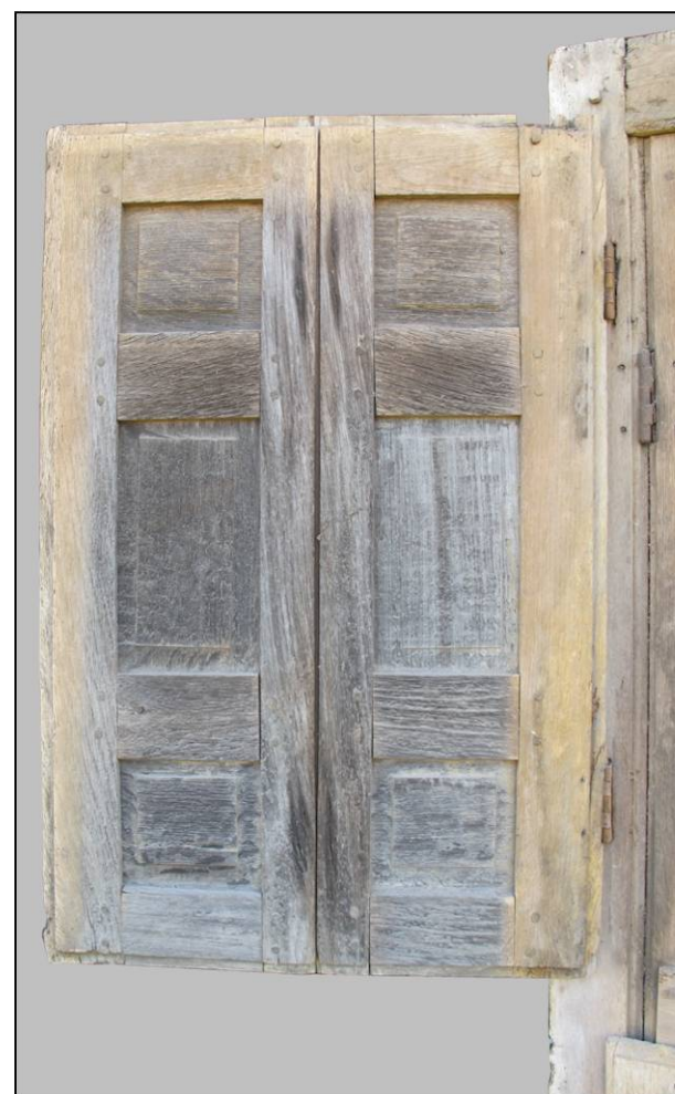
Fig. 1.5. Volet supérieur gauche