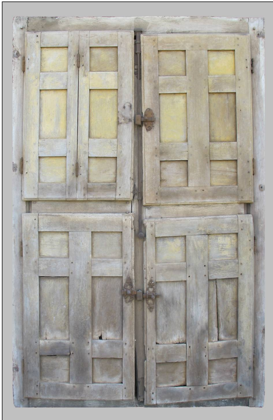
Fig. 1.1. Elévation intérieure