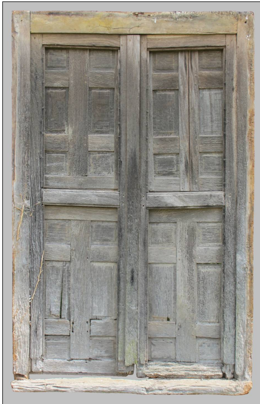
Fig. 1.2. Elévation extérieure