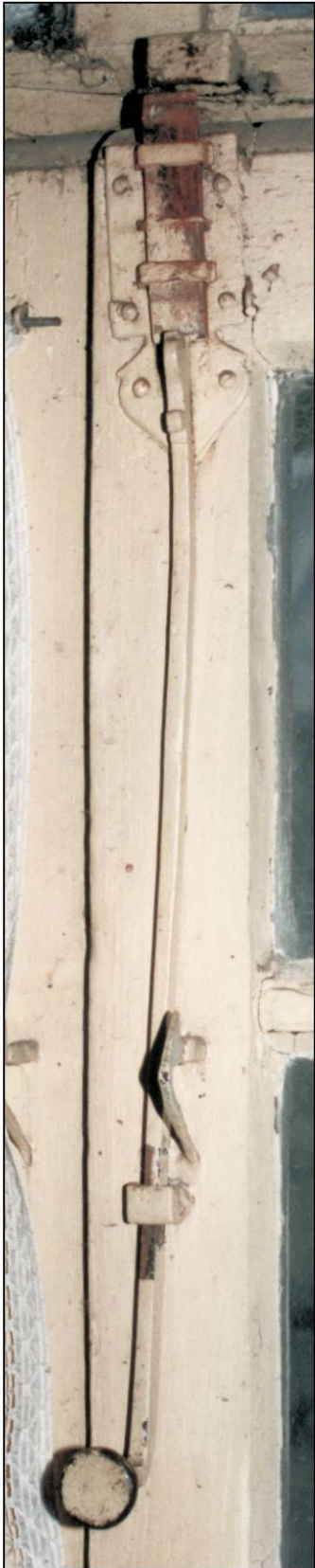
Fig. 2.1. Verrous