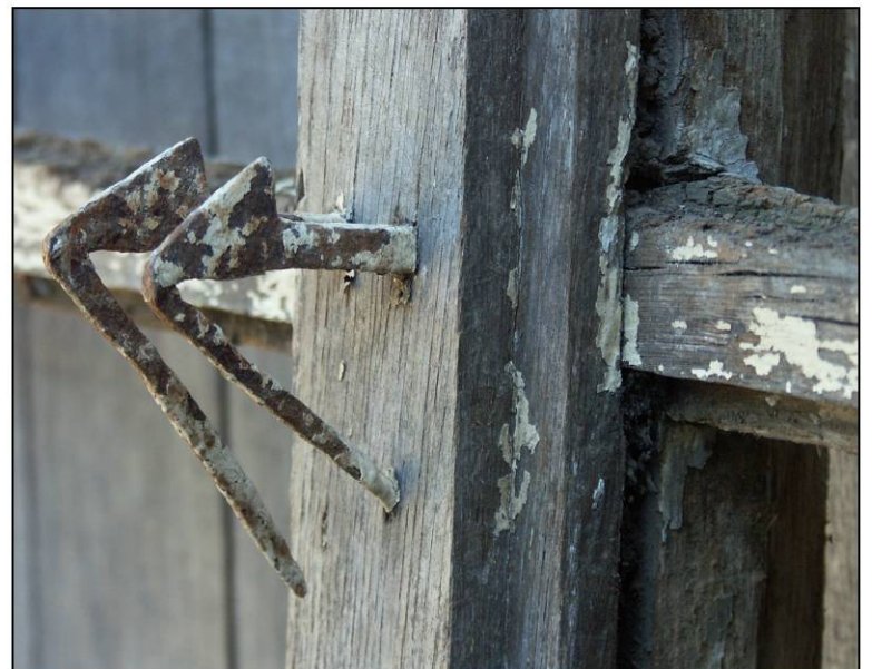
Fig. 2.5. Imposte (mentonnets)