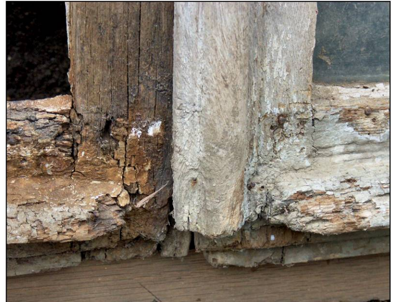
Fig. 2.3. Jets-d'eau et cote moulurée