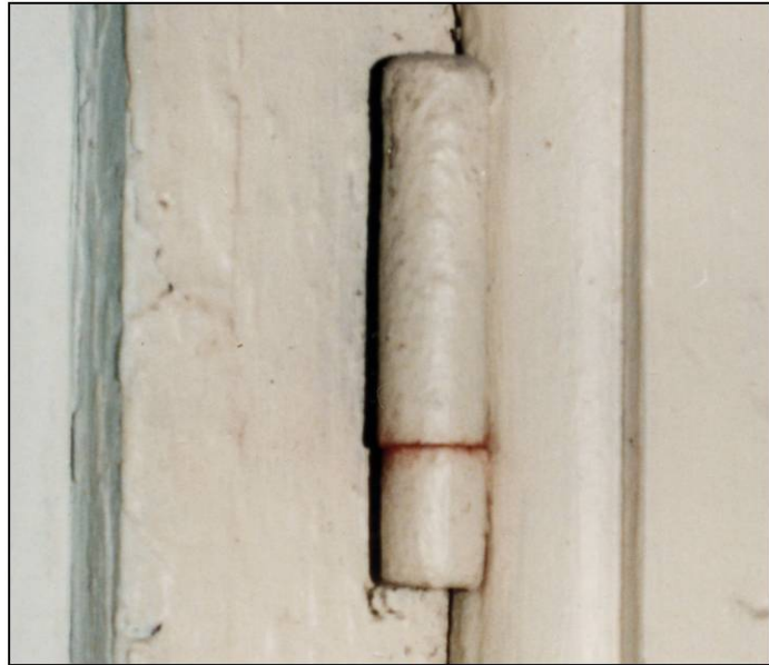
Fig. 2.2. Fiche à gond