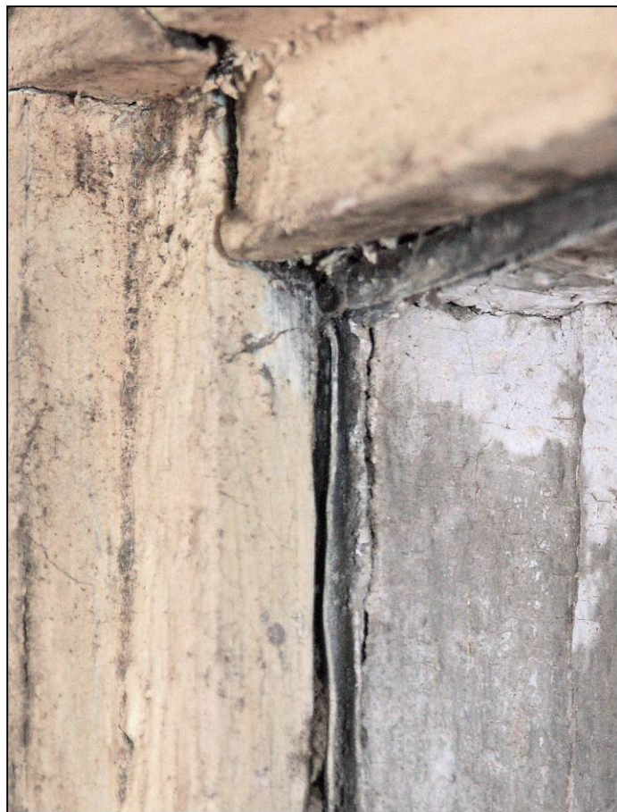
Fig. 2.4. Imposte (plomb de carreau)