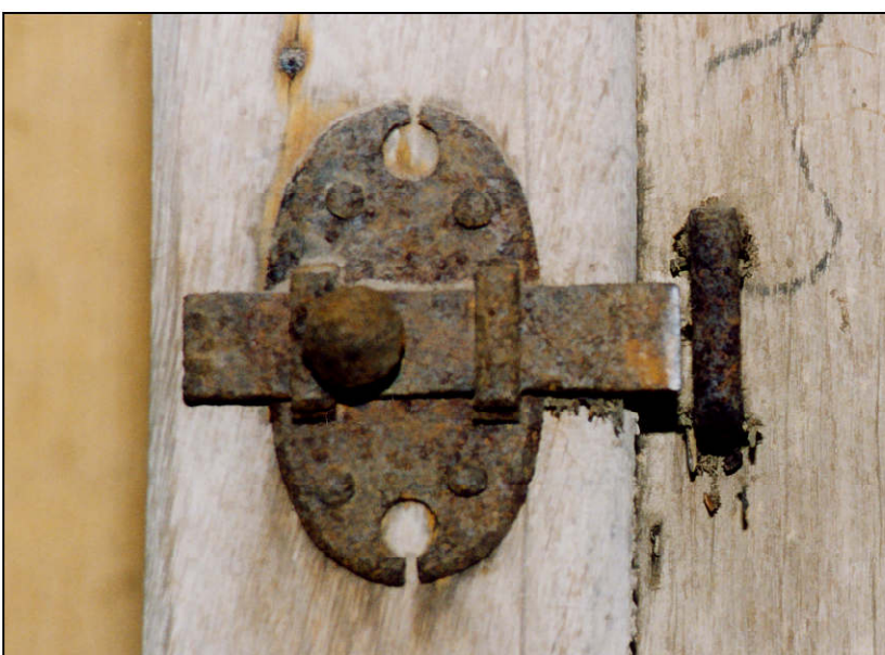
Fig. 2.7. Targette