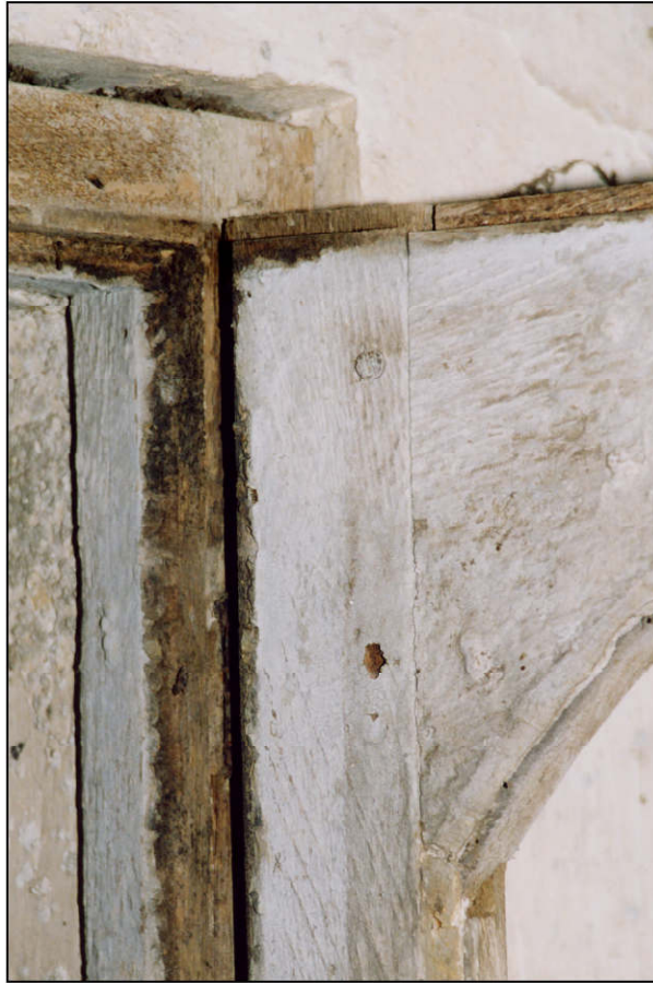
Fig. 2.2. Vantail vitré sup. et dormant (détail)