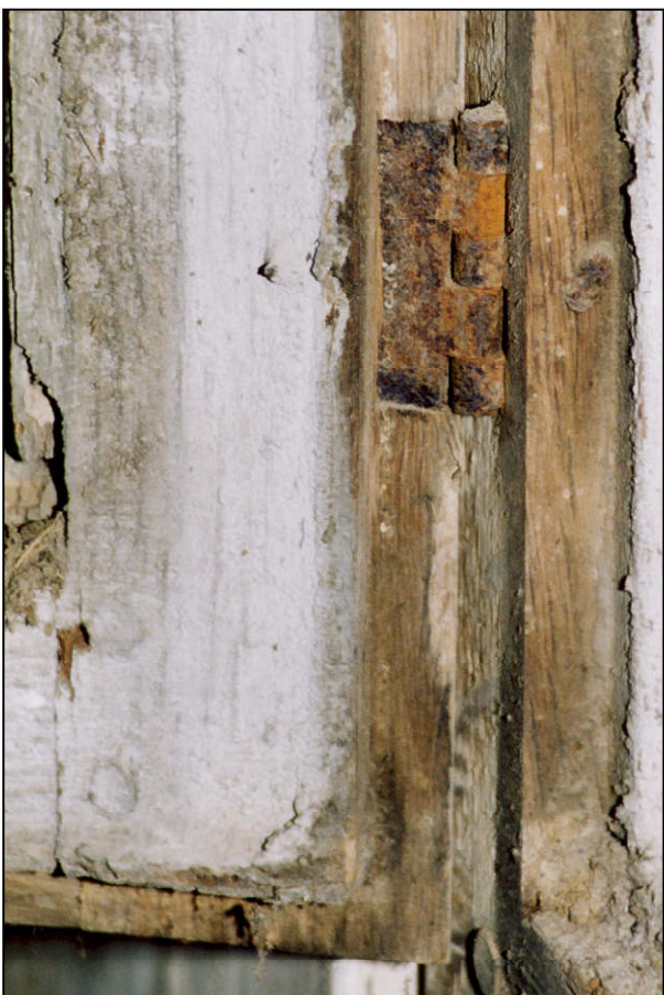
Fig. 2.4. Fiche