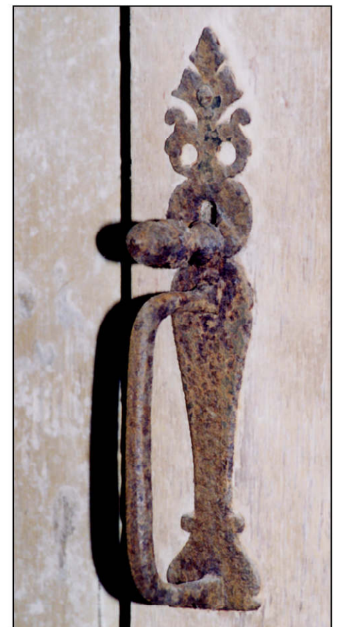
Fig. 2.6. Loquet à poucier (porte 2.3.)