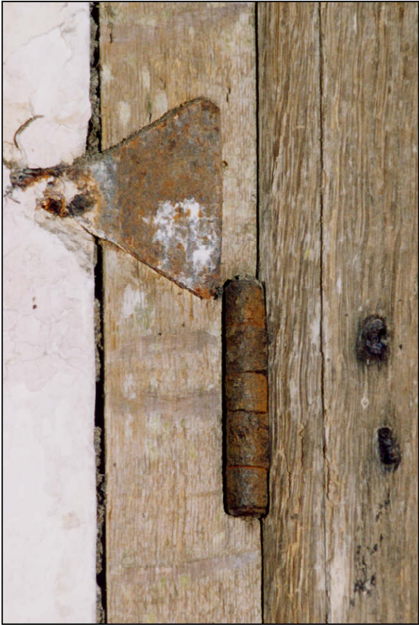
Fig. 2.1. Patte et fiche