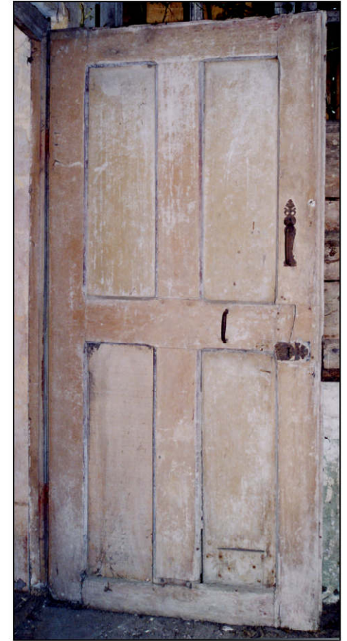
Fig. 2.3. Vantail de porte