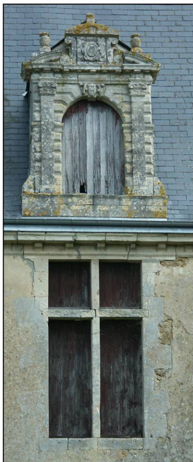
Fig. 1.5. Croisée et lucarne