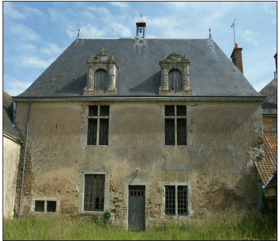
Fig. 1.3. Façade sur cour