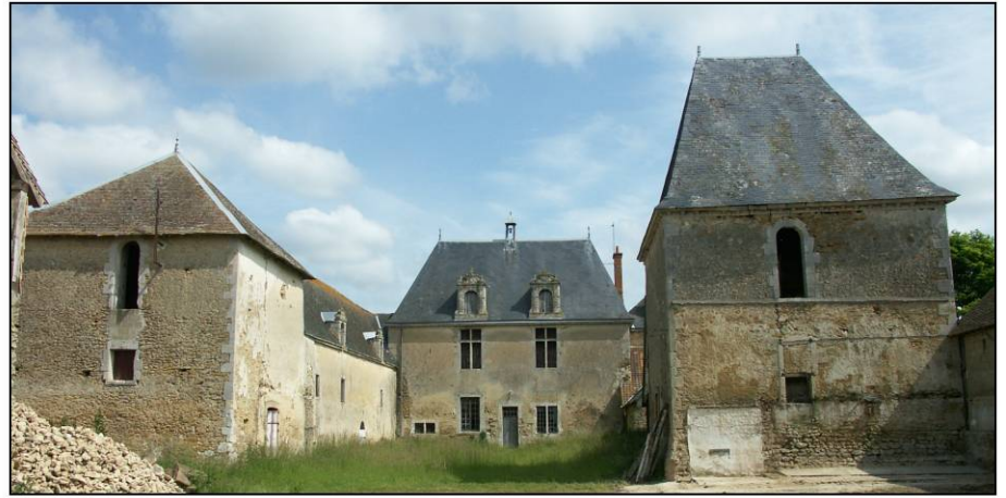
Fig. 1.2. Logis et pavillons antérieurs