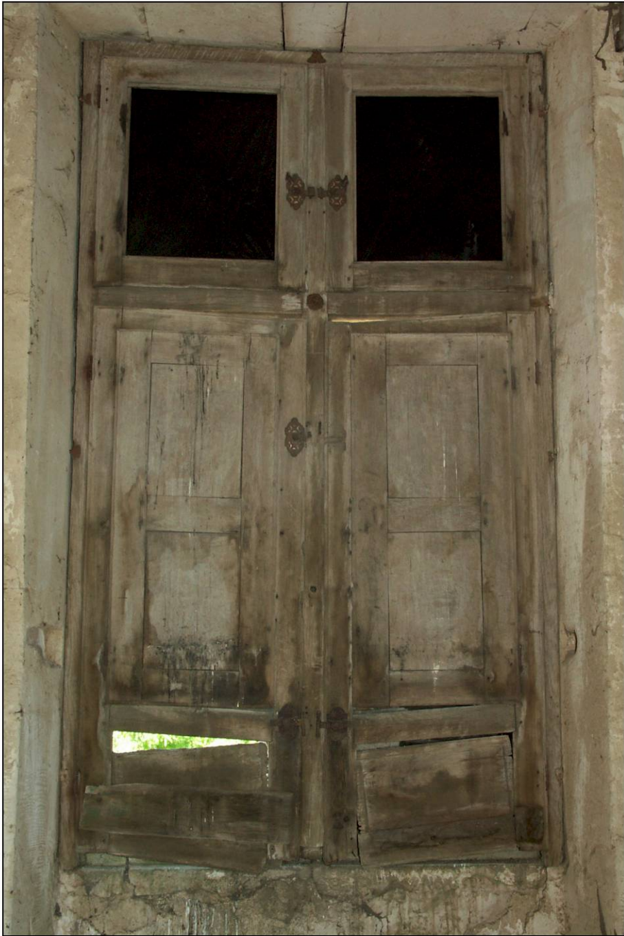
Fig. 1.1. Croisée (vue intérieure)