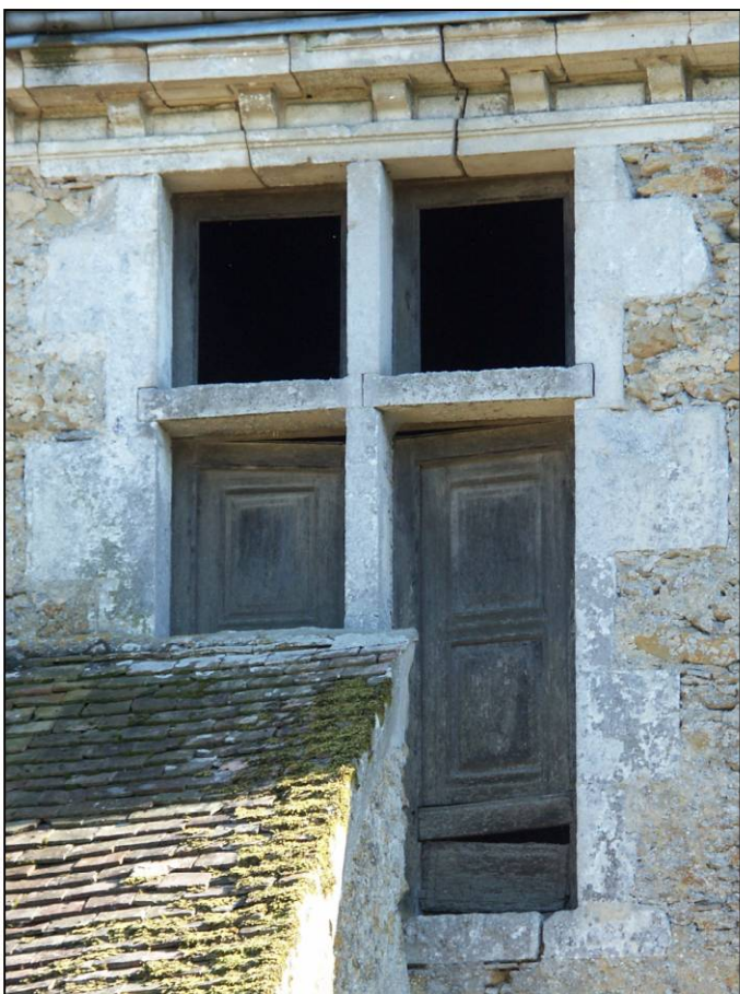
Fig. 1.4. Croisée (vue extérieure)