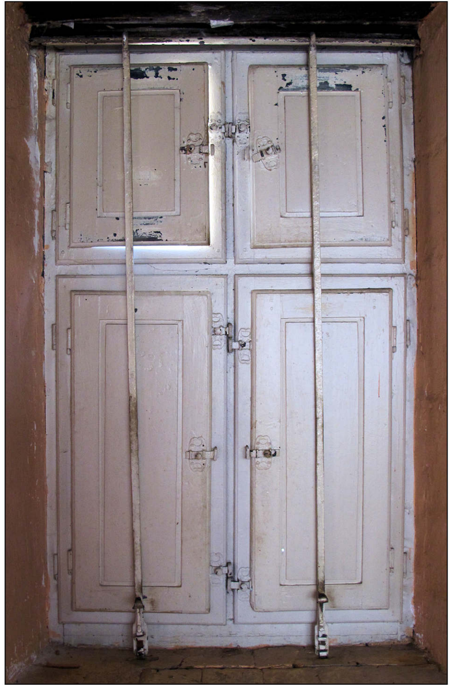
Fig. 3.2. Aile sud / croisée