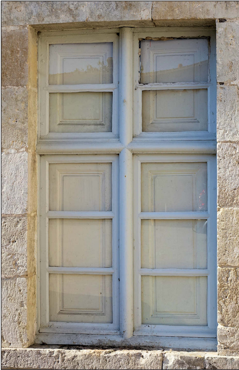
Fig. 3.1. Aile sud / croisée