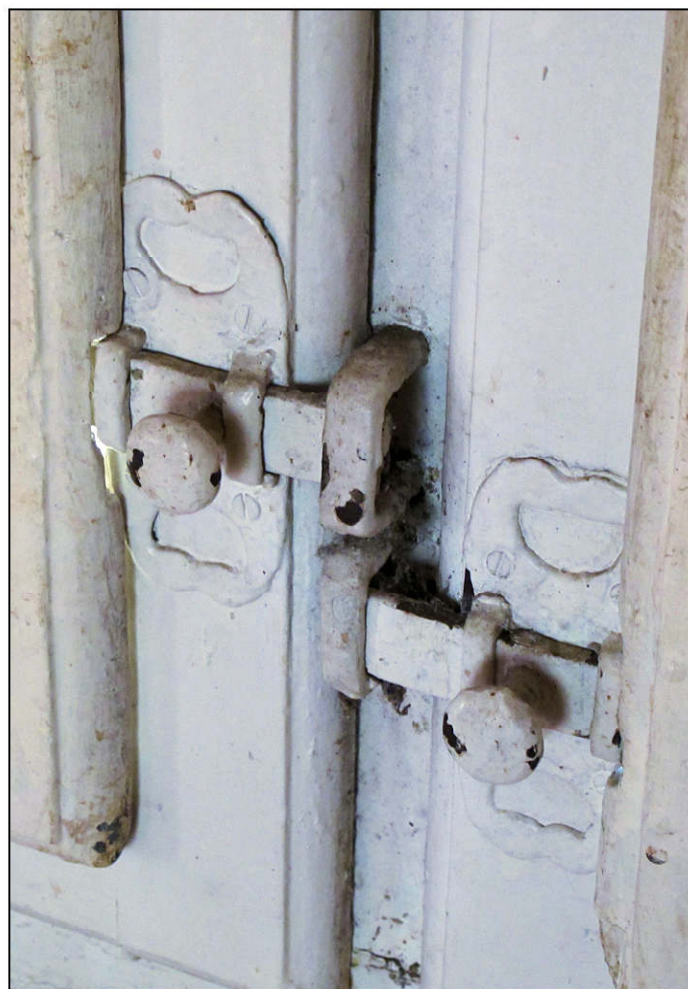
Fig. 3.4. Croisée (targettes)