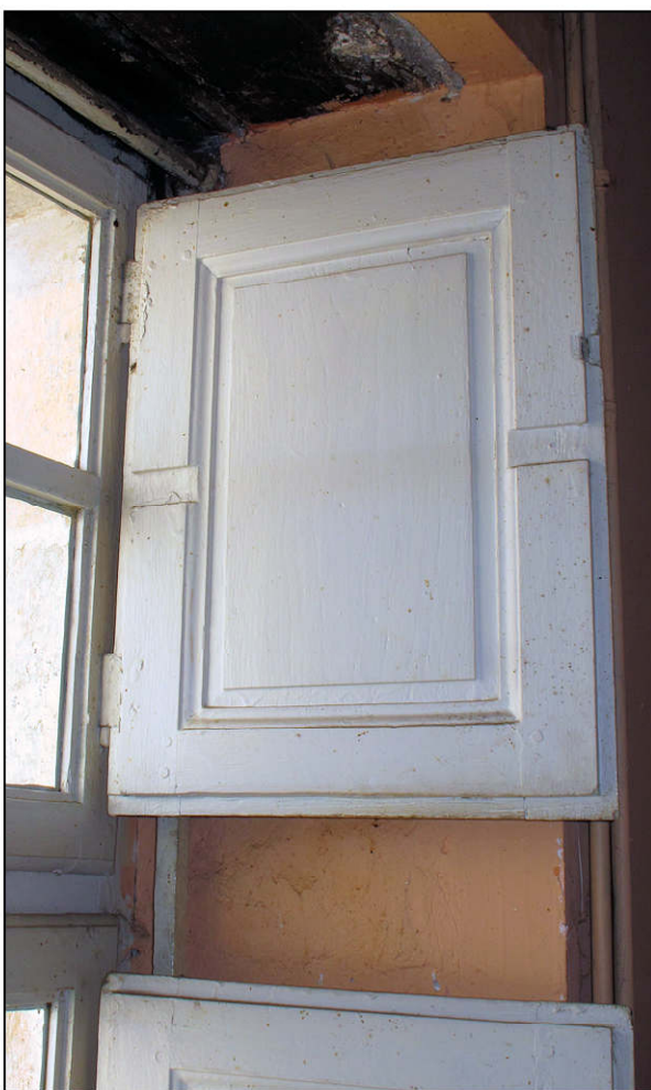
Fig. 3.3. Croisée (volets)