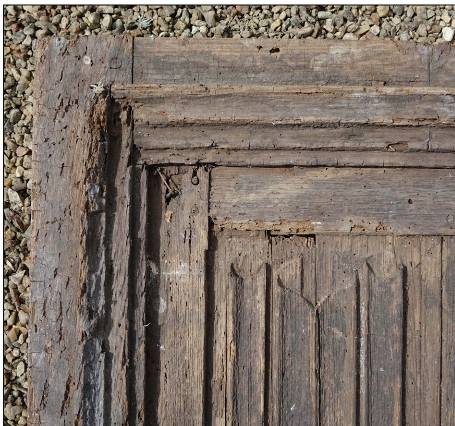
Fig. 5.3. Angle supérieur