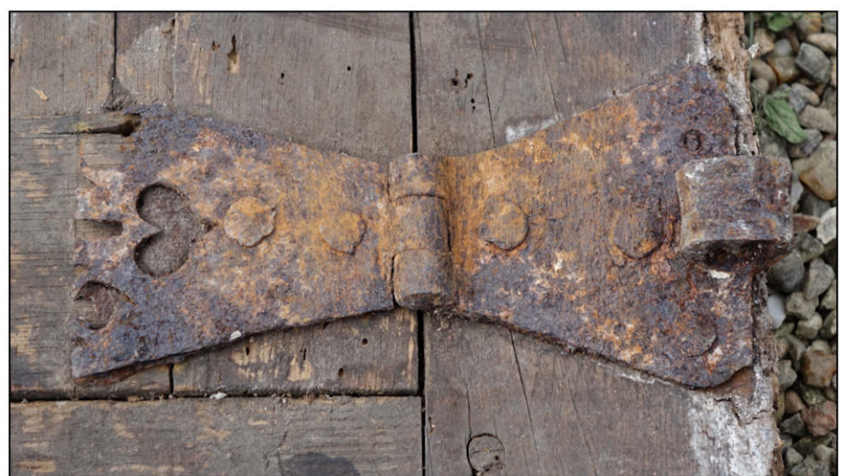
Fig. 5.6. Paumelle inférieure