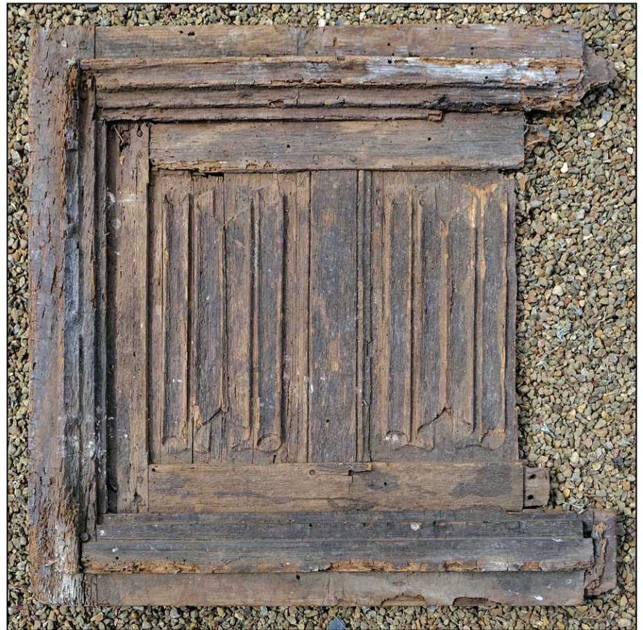
Fig. 5.2. Vue extérieure