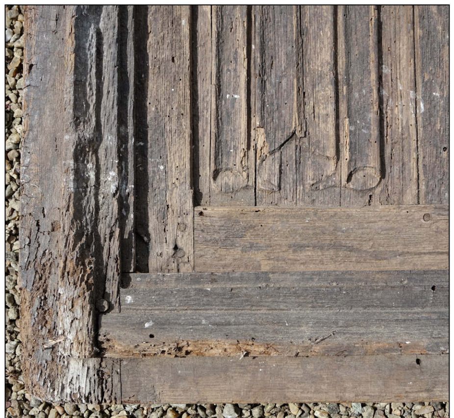
Fig. 5.4. Angle inférieur